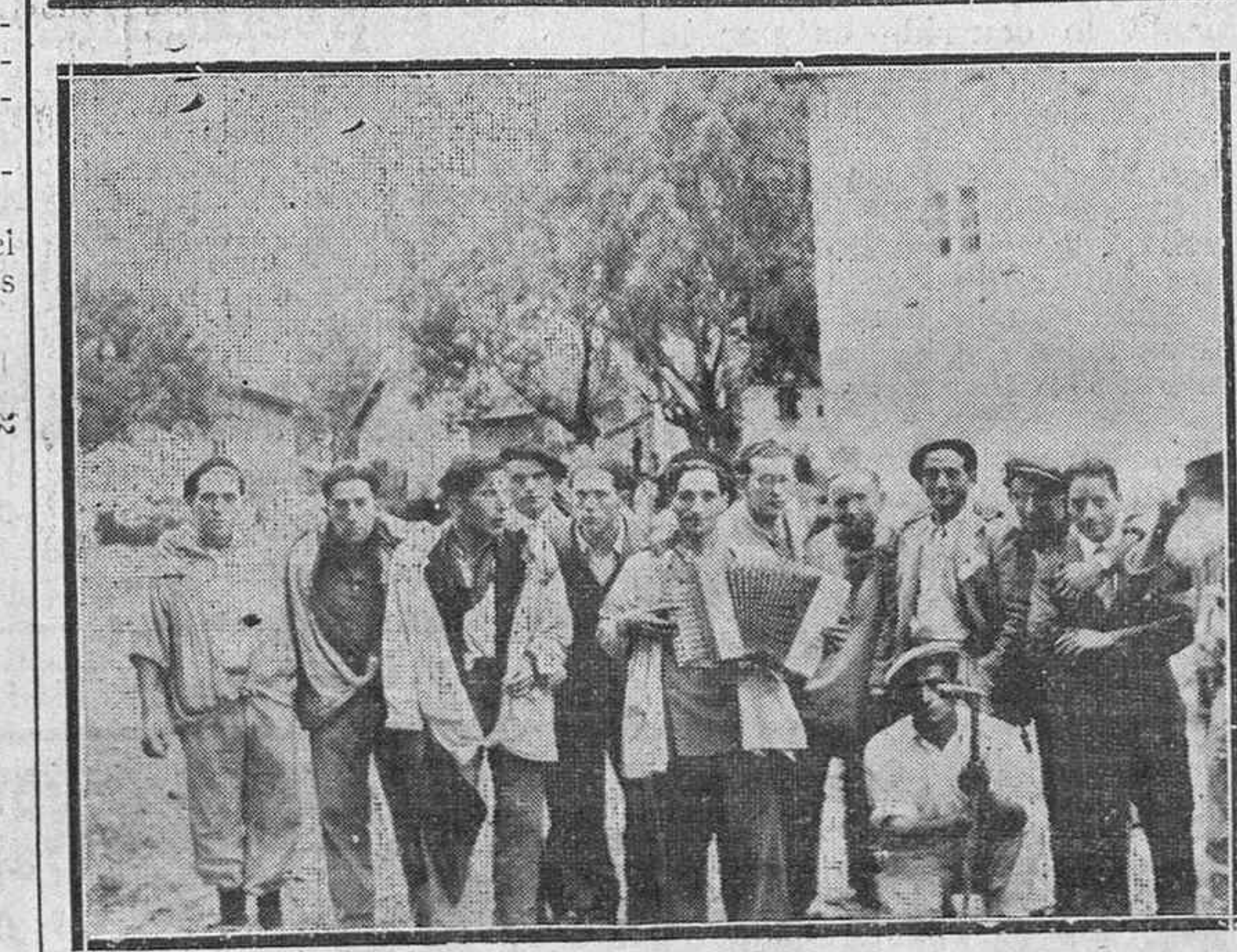
De las fiestas de Lagrán.—Un grupo de mozos en alegre comparsa.

Aconsejan explotar cada error de los Gobiernos burocráticos para obstaculizar la preparación de las guerras imperialistas, y preconiza también la formación de una agrupación «por encima de los partidos», pero cuyos animadores y beneficiarios serían los comunistas.