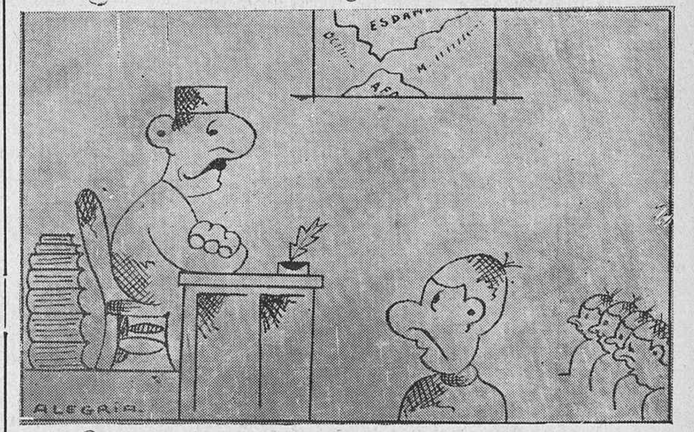
El maestro.—Por ejemplo, tienes cuatro pesetas en el bolsillo y te las pide tu madre: no queriendo tú dárselas, ¿con cuánto te quedas? El alumno.—Con una torta, señor maestro.

—¿No hay quien dé cien onzas para librar a este hombre de la muerte?—repite por segunda vez el pregonero. Igual silencio que antes acoge la pregunta. Rinconete tiritaba y pide que se apiaden de él.