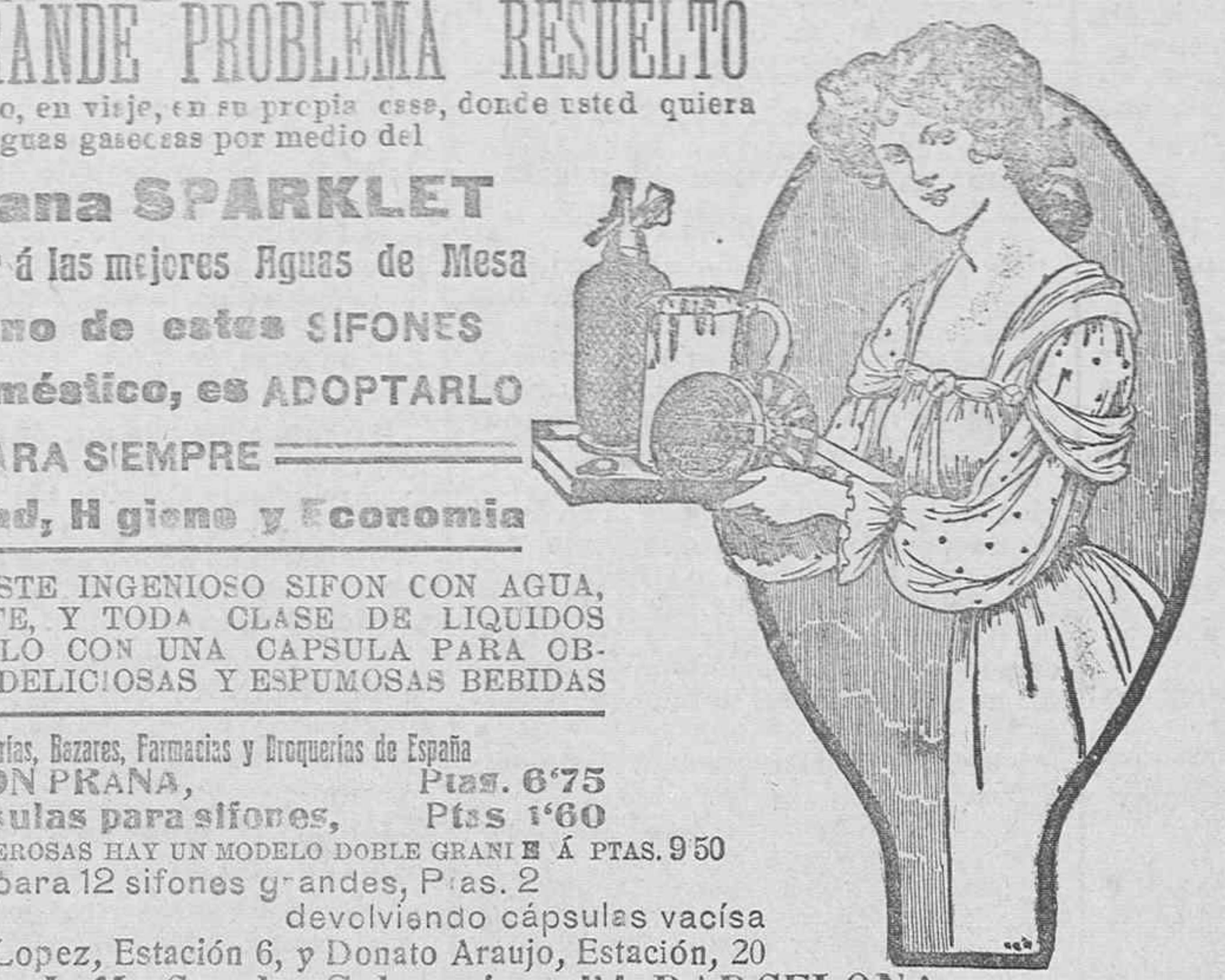
Véndese en Ferreterías, Bezares, Farmacias y Droguerías de España

Plaza de la Provincia número 3.—VITORIA Se han recibido en esta casa, las últimas ediciones de Libros de texto para CARBERAS MILITARES , así como toda clase de libros de texto para Seminarios, Instituto, Escuelas especiales, Normales y demás centros docentes, á precios reducidos. 15-5