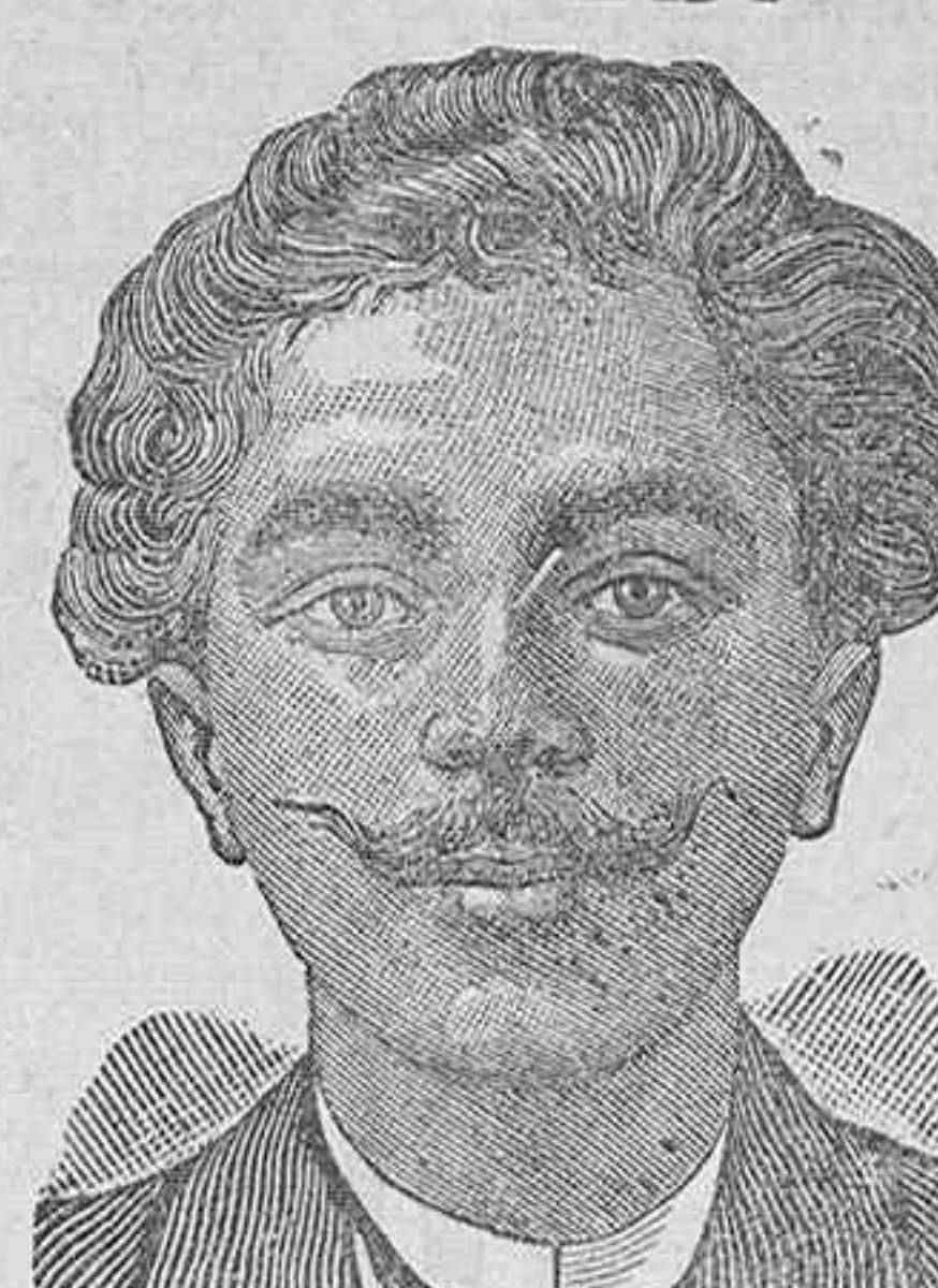
Antes de la curacion