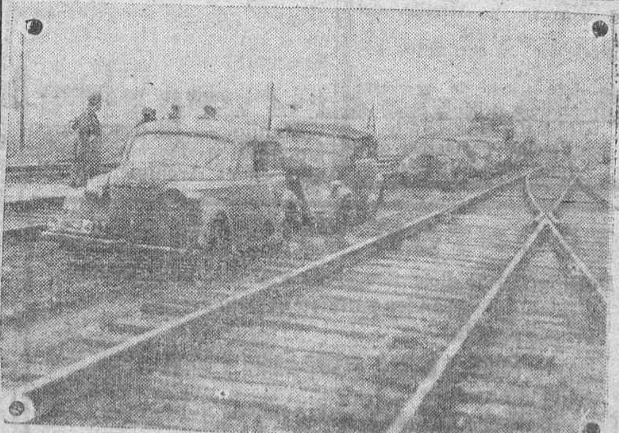
El mal estado de las carreteras rusas hace que las columnas motorizadas alemanas utilicen ambos lados del ferrocarril soviético por ser más firme el terreno.