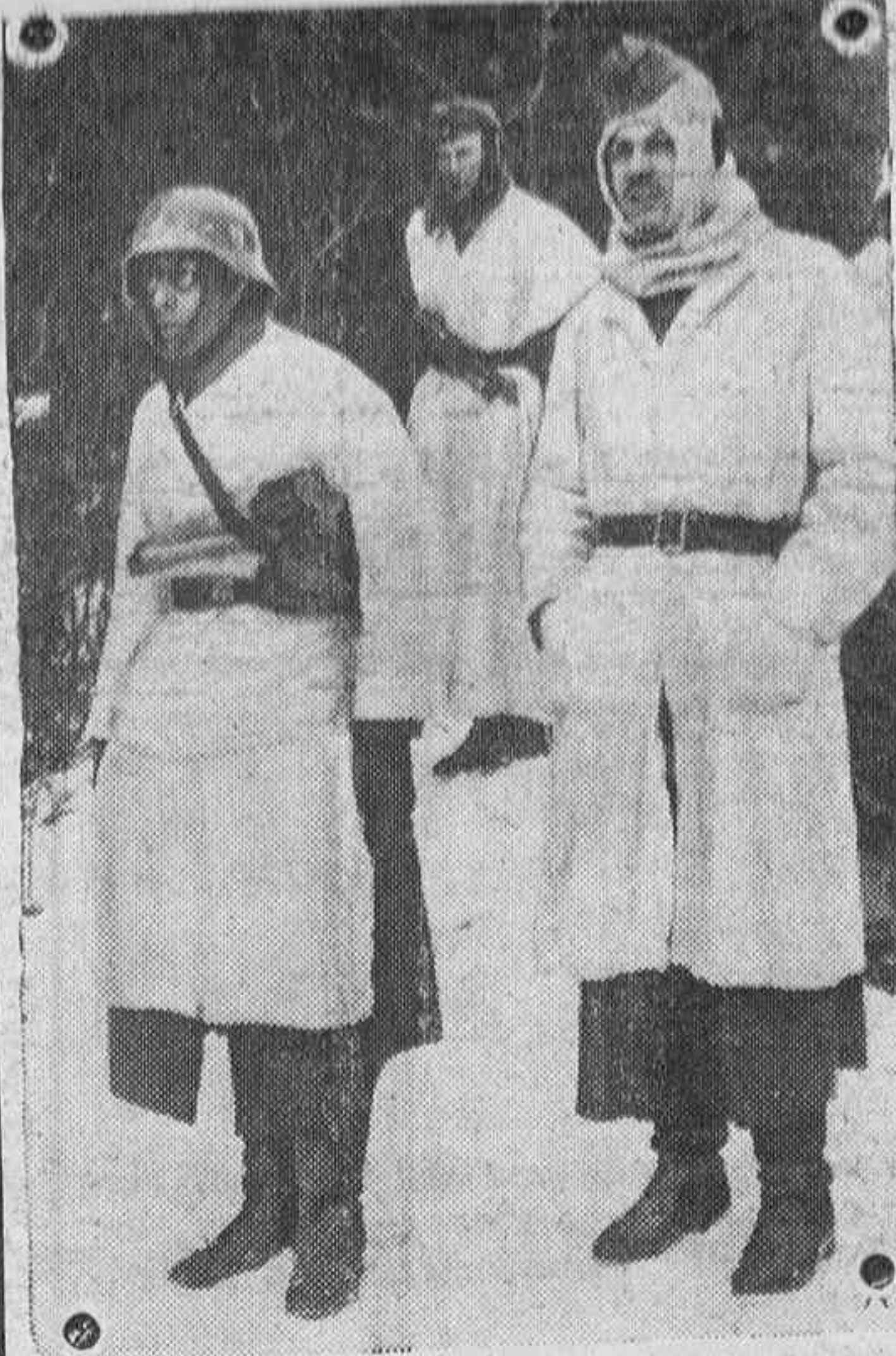
Del Frente Oriental. — Tiradores alemanes camuflados para la lucha en la nieve.