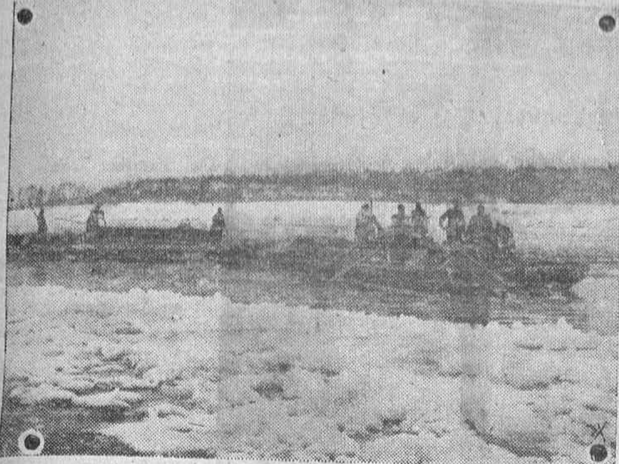
Para el transporte de víveres en Rusia los soldados alemanes aprovechan en todas las ocasiones posibles los ríos, para compensar la escasez y mal estado de las carreteras.