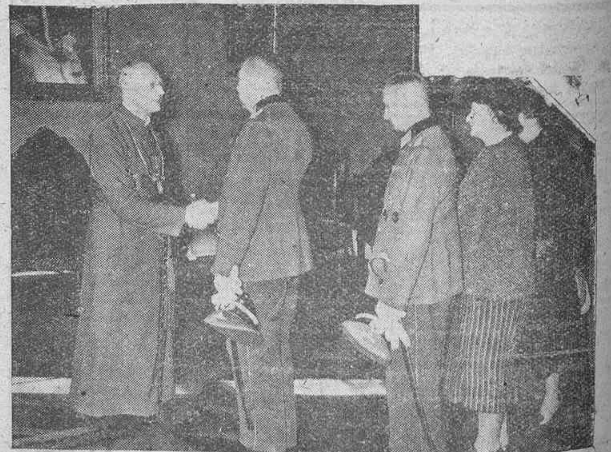
El Arzobispo de Paderborn recibe el saludo de las autoridades del Ejército y del Reich.

Ponemos en conocimiento del público, que en lo sucesivo no se darán informes sobre los anuncios ni otras referencias, en la Administración de este diario.