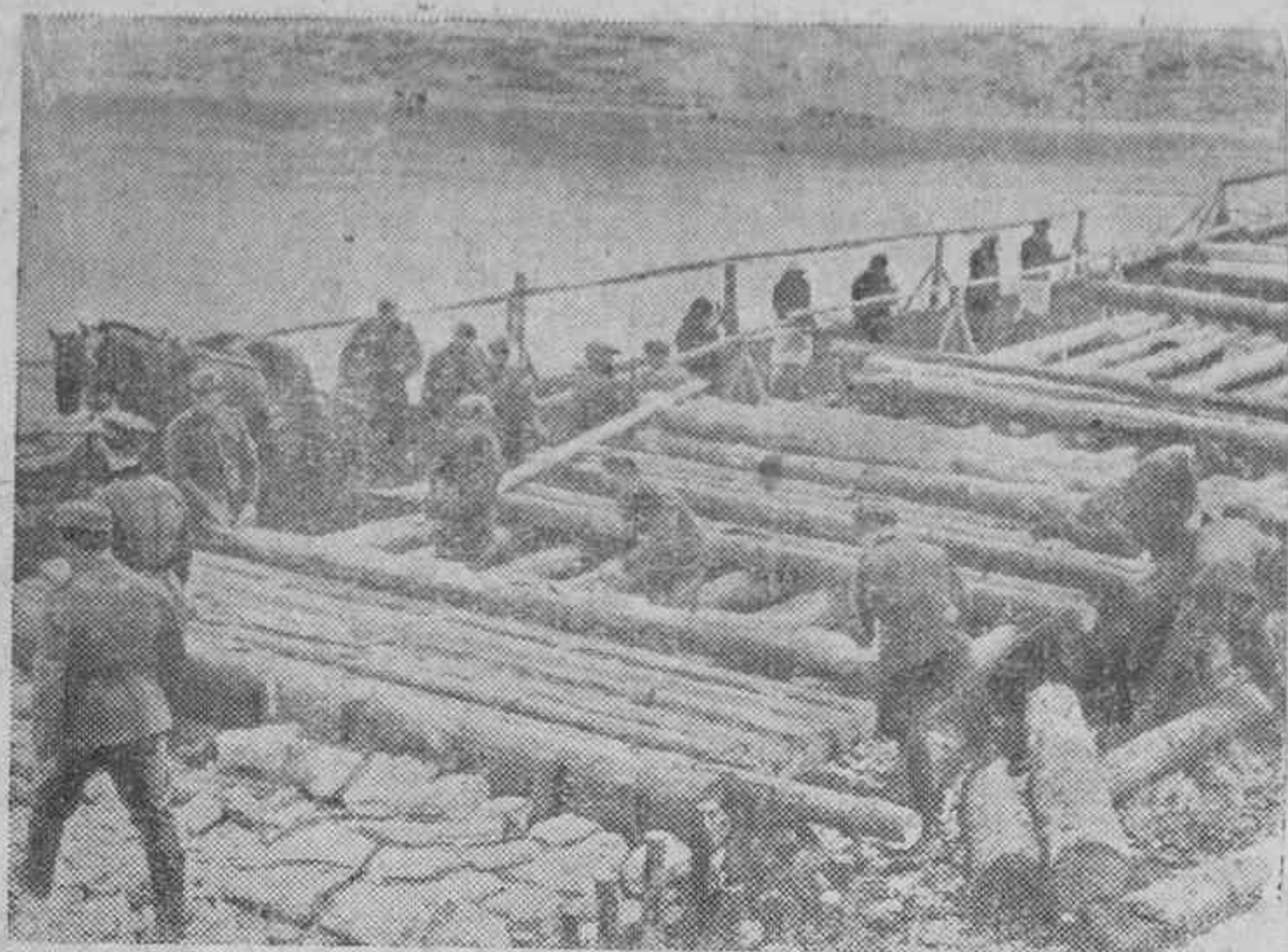
Los pontoneros alemanes han construido con suma rapidez un pequeño puente sobre el río ruso para que no se interrumpa la marcha y ahora preparan el material para otro más consistente por donde pueda pasar el material más pesado.