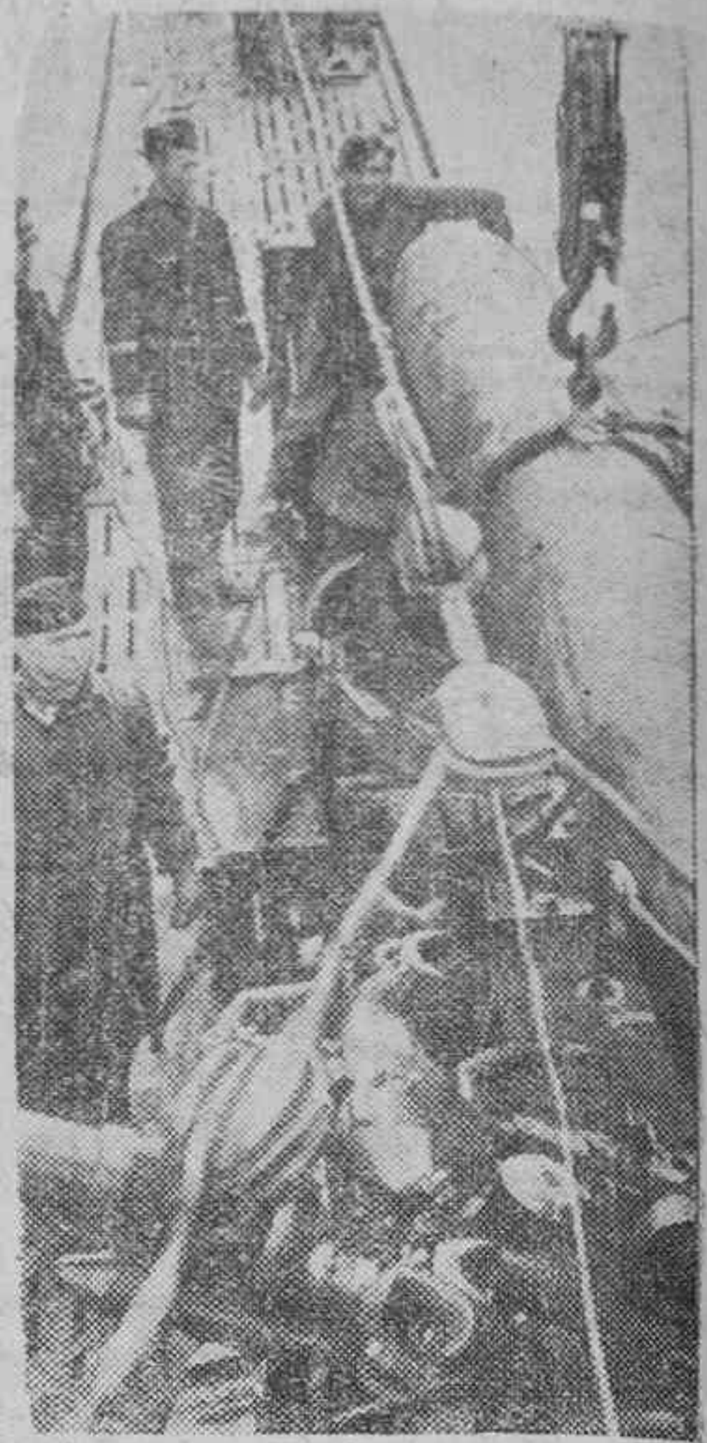
Un submarino alemán de los que guardan la costa europea, preparándose para una nueva salida.

LABRADOR: Tu Diputación ha puesto en tus manos todos los medios para combatir el escarabajo. No seas remiso, adquiere los elementos que necesitas.