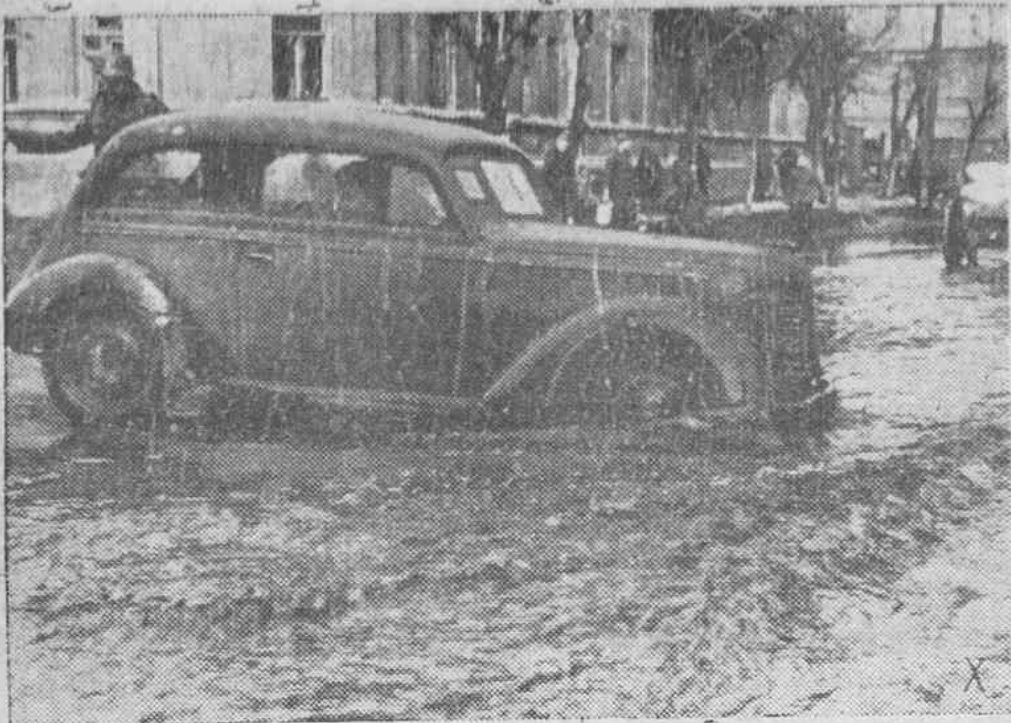
El principio de la primavera en el Dnezh se caracteriza por las inundaciones que ocasiona el deshielo, como vemos en esta calle de una ciudad, ocupada por los alemanes. Pero en contra de todo, los vehículos alemanes que van al frente no cejan en su labor.