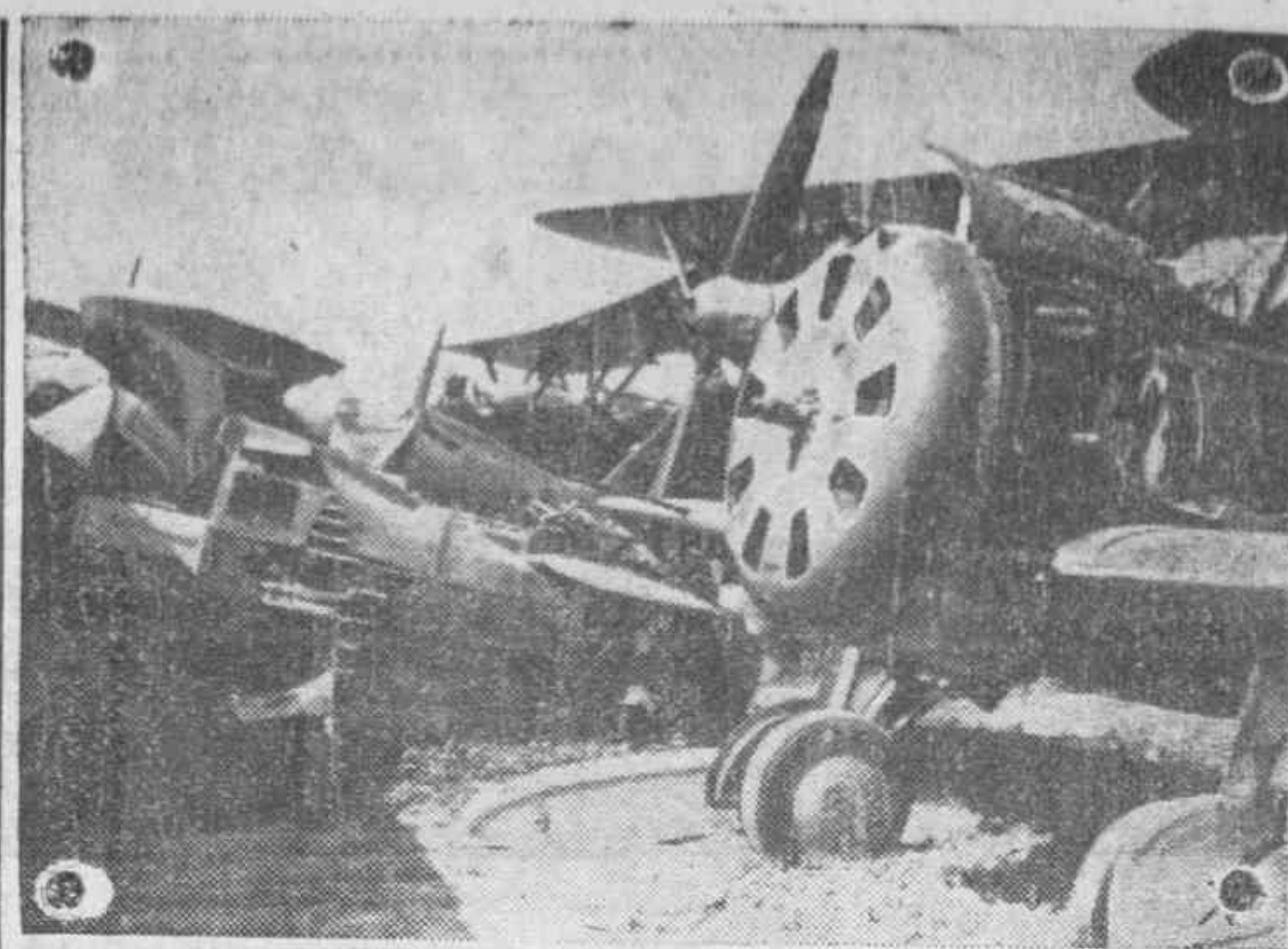
Aviones soviéticos abandonados por los soviets en un aeródromo conquistado después por los alemanes.

La próxima reunión se celebrará en septiembre en Bucarest. — (Efe).