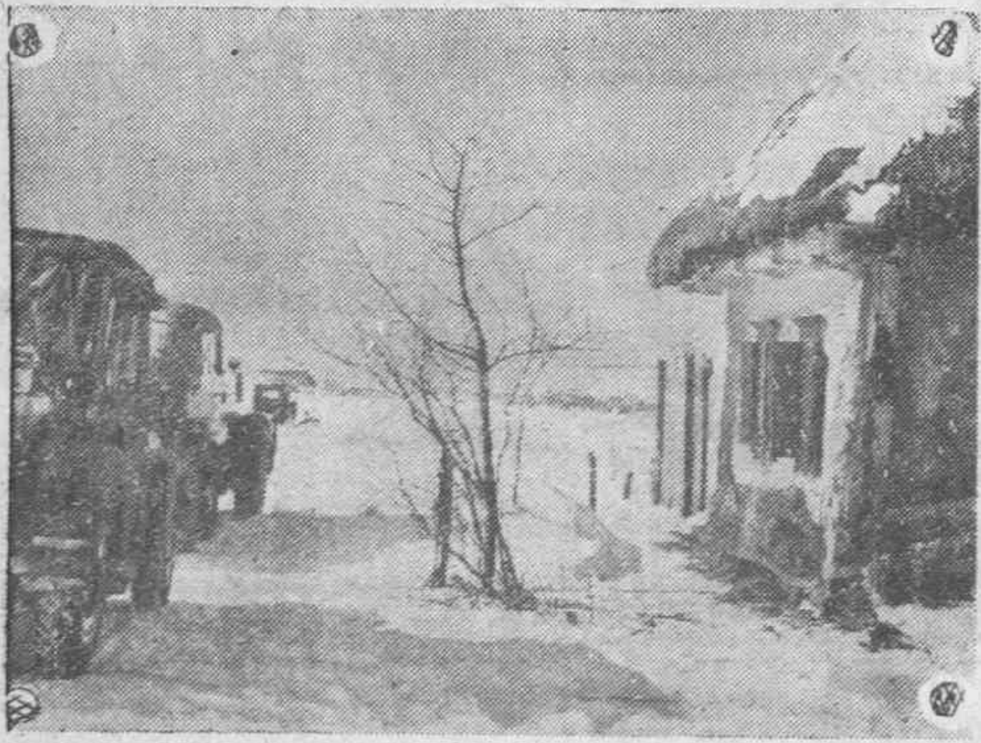
Aunque la nieve no es indicio de primavera, en este paisaje ruso por el que pasa una columna alemana, ya los árboles que retoñan indican su llegada

Miguel Menéndez. — Compra. Venta de Fincas. — Miranda de Ebro.