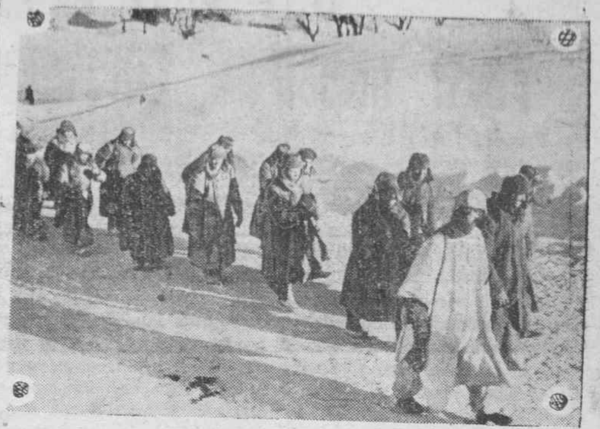
Prisioneros rusos cogidos por un destacamento alemán en una operación de limpieza.

El Cairo. — El ministro de Agricultura ha declarado que el 22 por 100 de los territorios del bajo Egipto se emplearán para el rendimiento algodonero. Este producto es posible que se recolecte en una proporción total de cinco millones de cantaros. El resto se empleará para la siembra de cereales, tan necesarios en la economía egipcia.—(Efe).