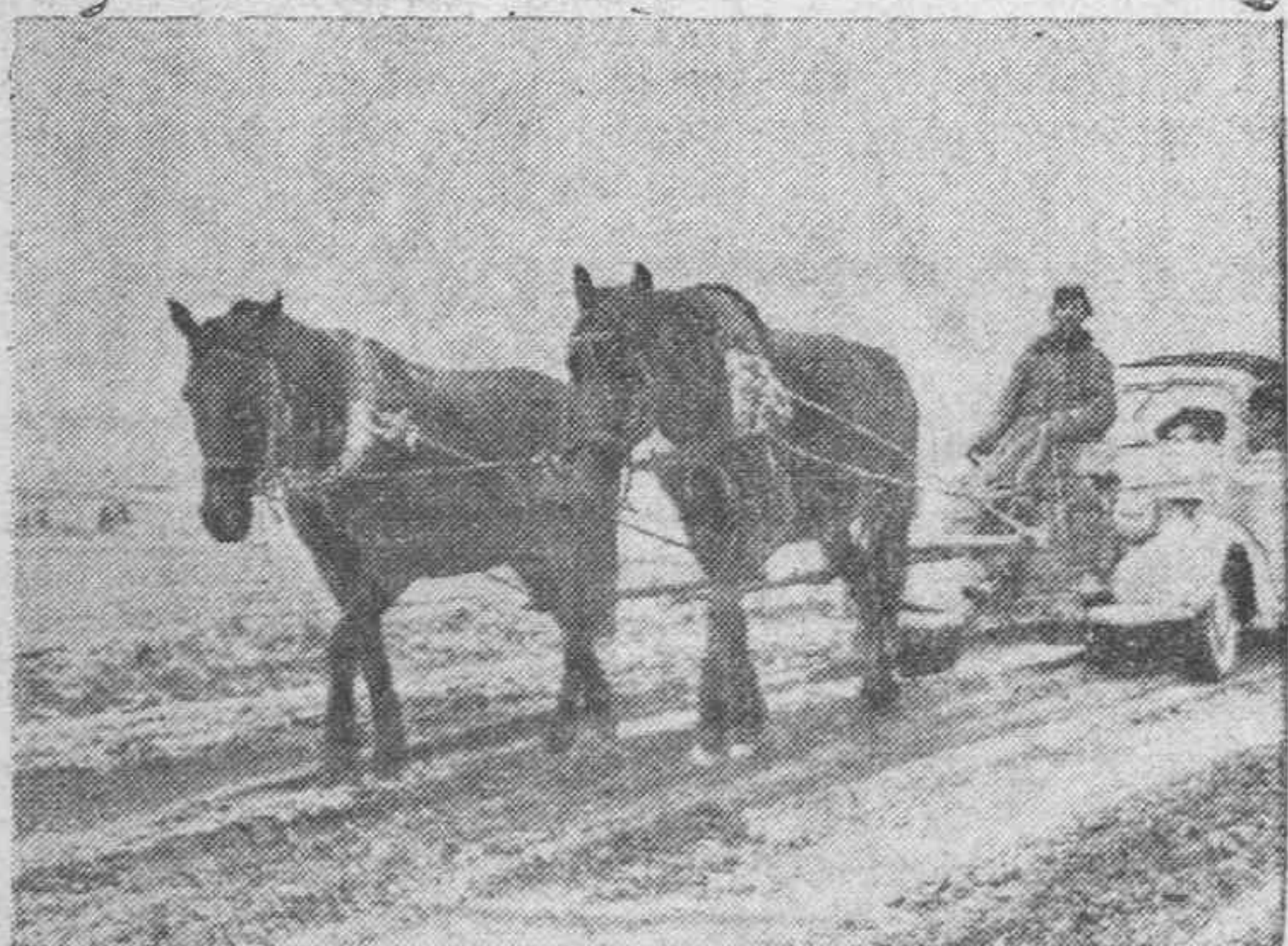
Este coche alemán que ha quedado averiado en una de las infames carreteras de Rusia es remolcado por dos caballos hasta el próximo pueblo donde será inmediatamente reparado.

Berlín.—Según señala el comunicado del Reich en el Africa del Norte y durante la noche del 5 fueron atacados los aeródromos e instalaciones del Canal de Suez, al Sur del Lago Amargo, siendo destruidos cobertizos, instalaciones y aviones en el suelo. Los objetivos militares de la cuenca de Alejandría fueron atacados igualmente por los aviones del Eje.—Efe.