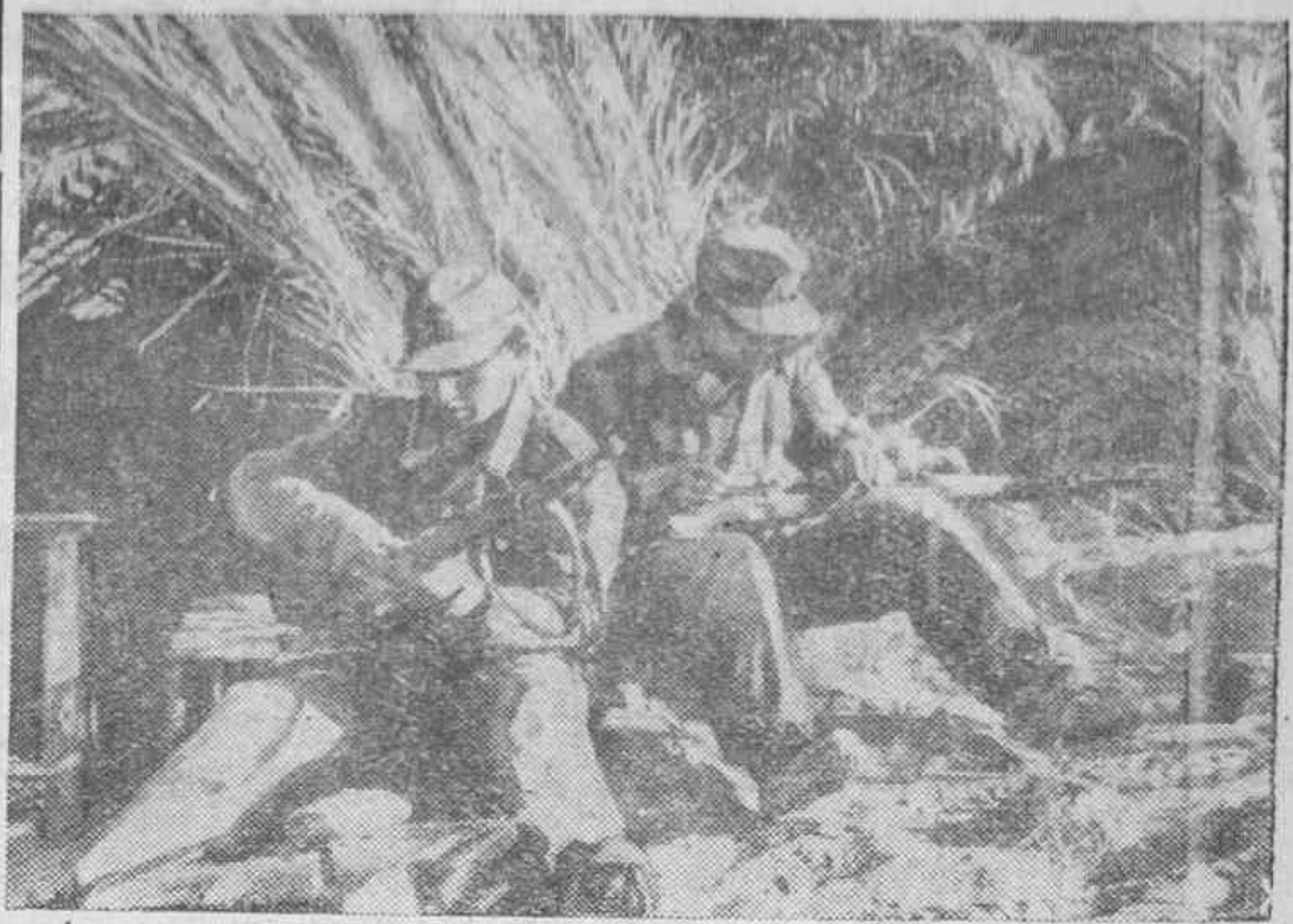
El fino polvo del desierto penetra por todas partes. Los soldados del cuerpo alemán africano limpian sus armas con especial esmero.