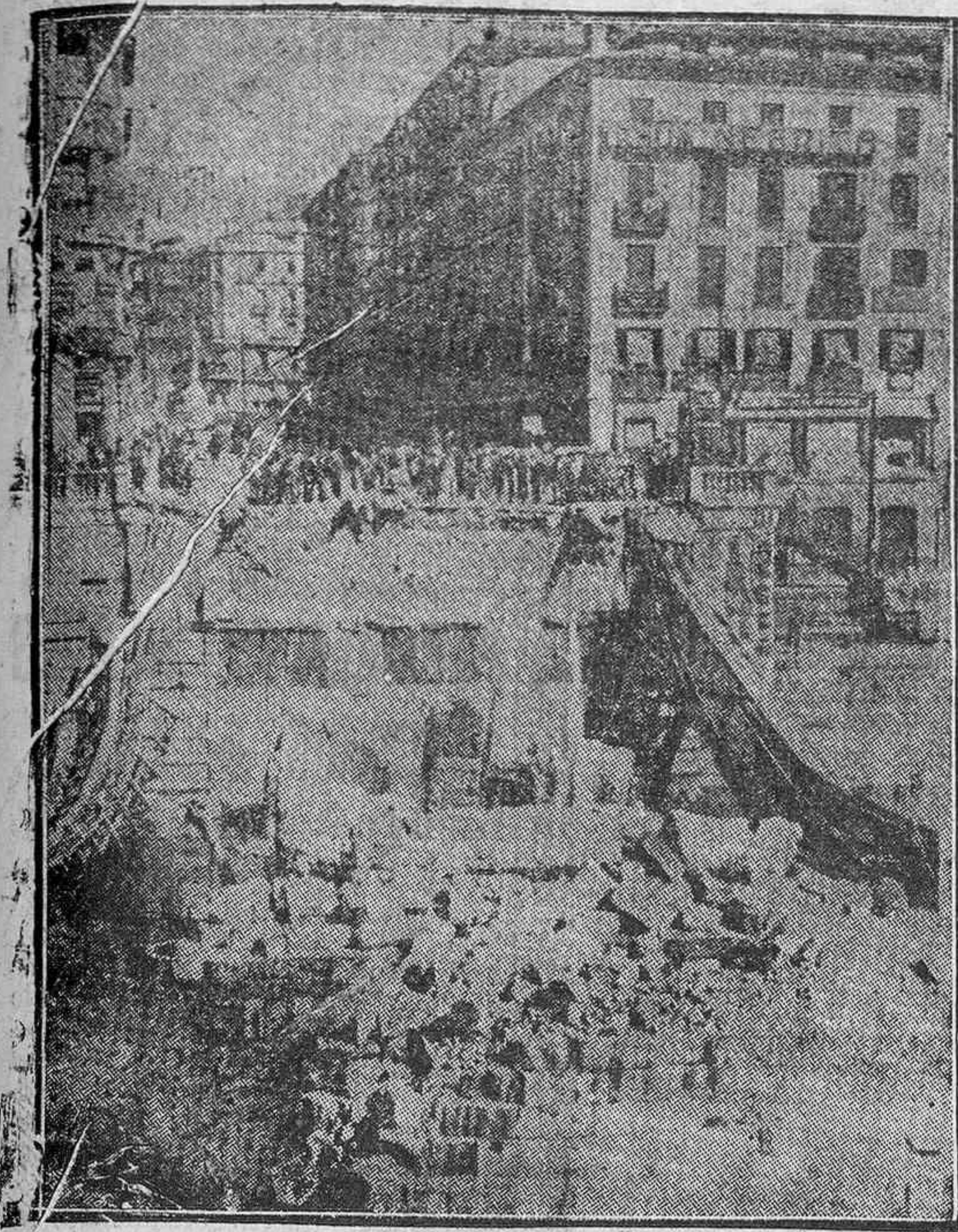
Por aquí pasaron los vándalos del Norte, que incapaces de enfrentarse con nuestros Ejércitos, se dedicaron a tirar los puentes bilbaínos, como lo demuestra el estado en que ha quedado este puente llamado de Isabel II, una de las más afluídas arterias de la villa del Nervión

La unidad es el secreto de la fortaleza de los pueblos. La unidad tiene que ser de pensamiento, de acción y de corazón. FRANCO es hoy el símbolo de la UNIDAD.