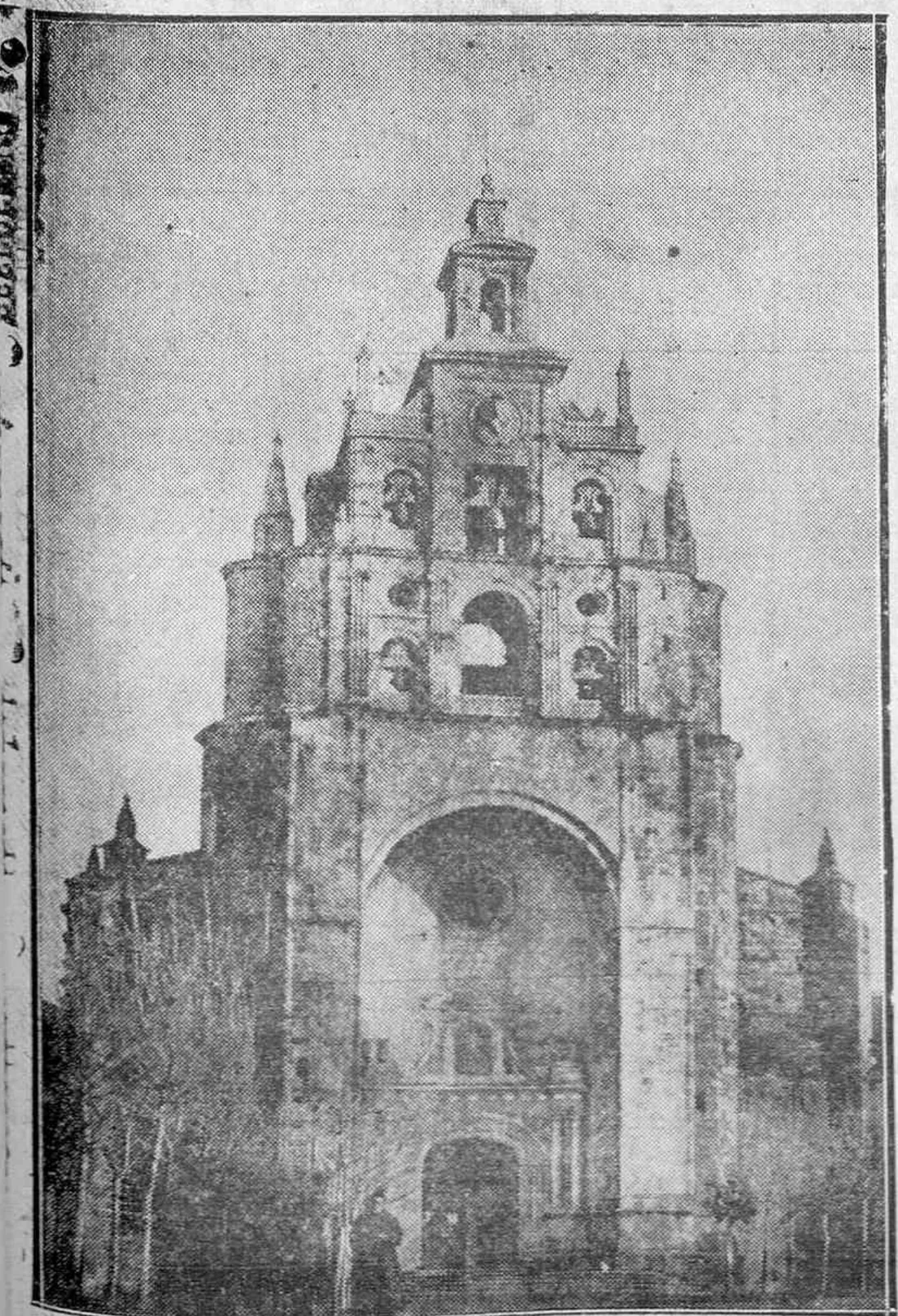
Begoña, que durante muchos años veló Bilbao, rompe ya con el Bilbao rojo. Desde ahora, Begoña será vigía espiritual sobre la tierra regenerada.

Piensa que todos debemos contribuir al resurgir de la Patria