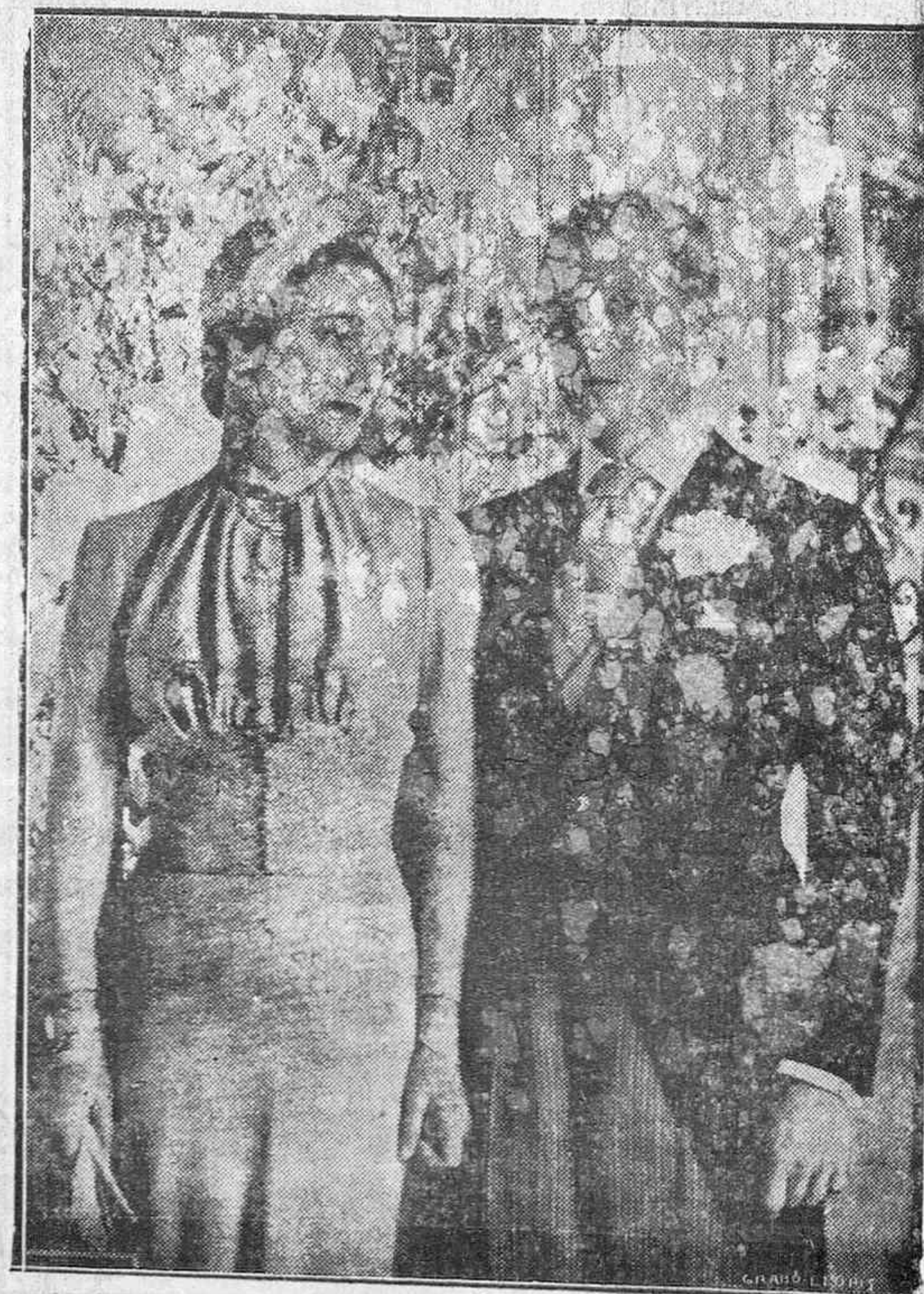
El ex rey Eduardo VIII, conde de Windsor, retratado con su novia el día de sus esponsales

Se pone en conocimiento de todos los adheridos a la Obra Nacional Corporativa que sus oficinas se han trasladado a la Casa Social Católica (Vicente Golea, número 5, piso primero), donde seguirán funcionando con la misma normalidad. Teléfono, número 1802.