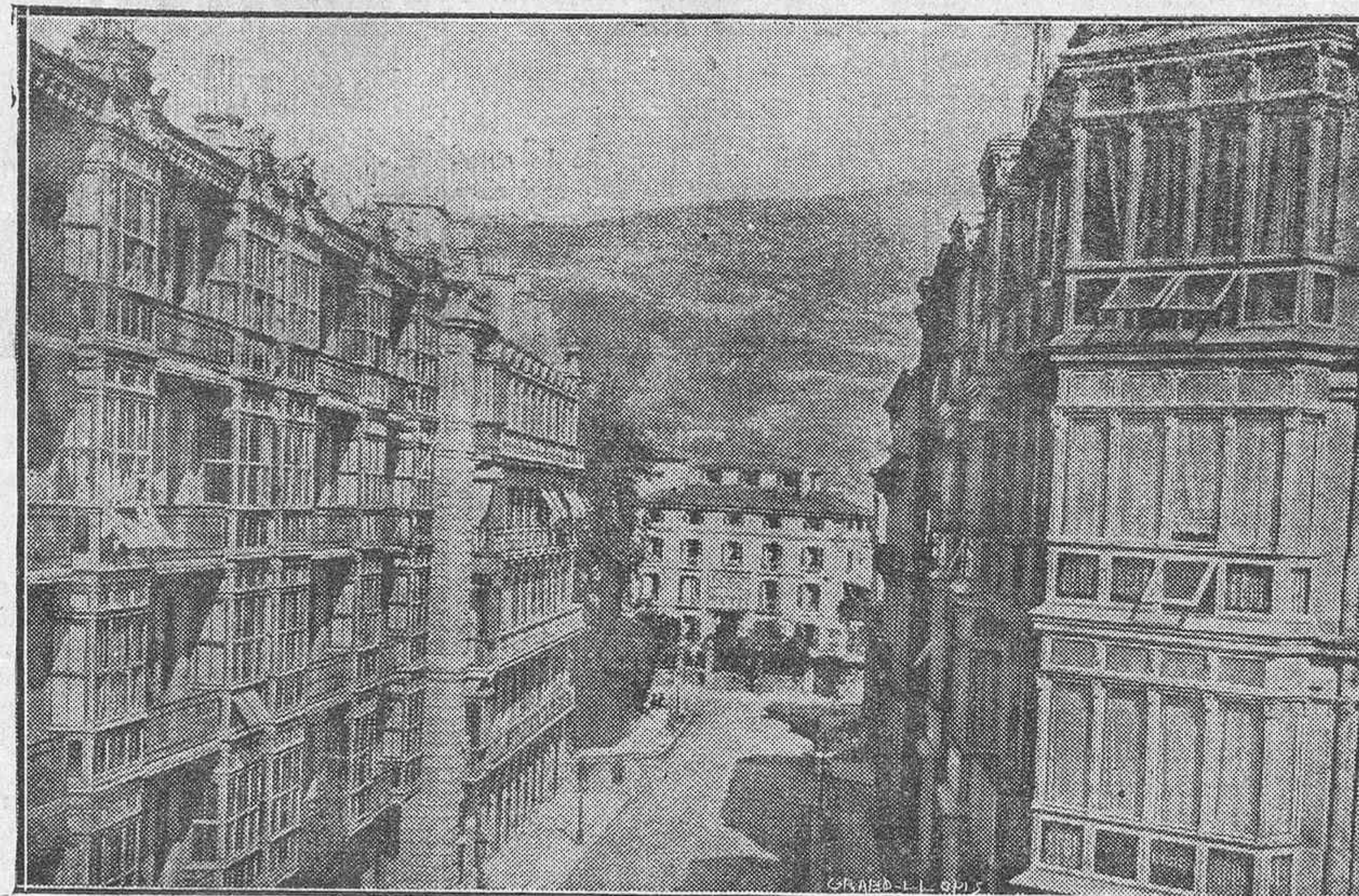
Una calle de Bilbao. Al fondo, la casa que fué Sabin Etxea. Sobre ella, dominándola, la altura de Archanda.

Nuestras tropas, a la vista cercana del objetivo ansiado, se hallan en inmejorables condiciones para dar el ataque definitivo a la capital de Vizcaya y convertir en realidad el sueño del General Mola que lo ideó y planeó y que el General Dávila con acierto insuperable está llevando a la realidad.