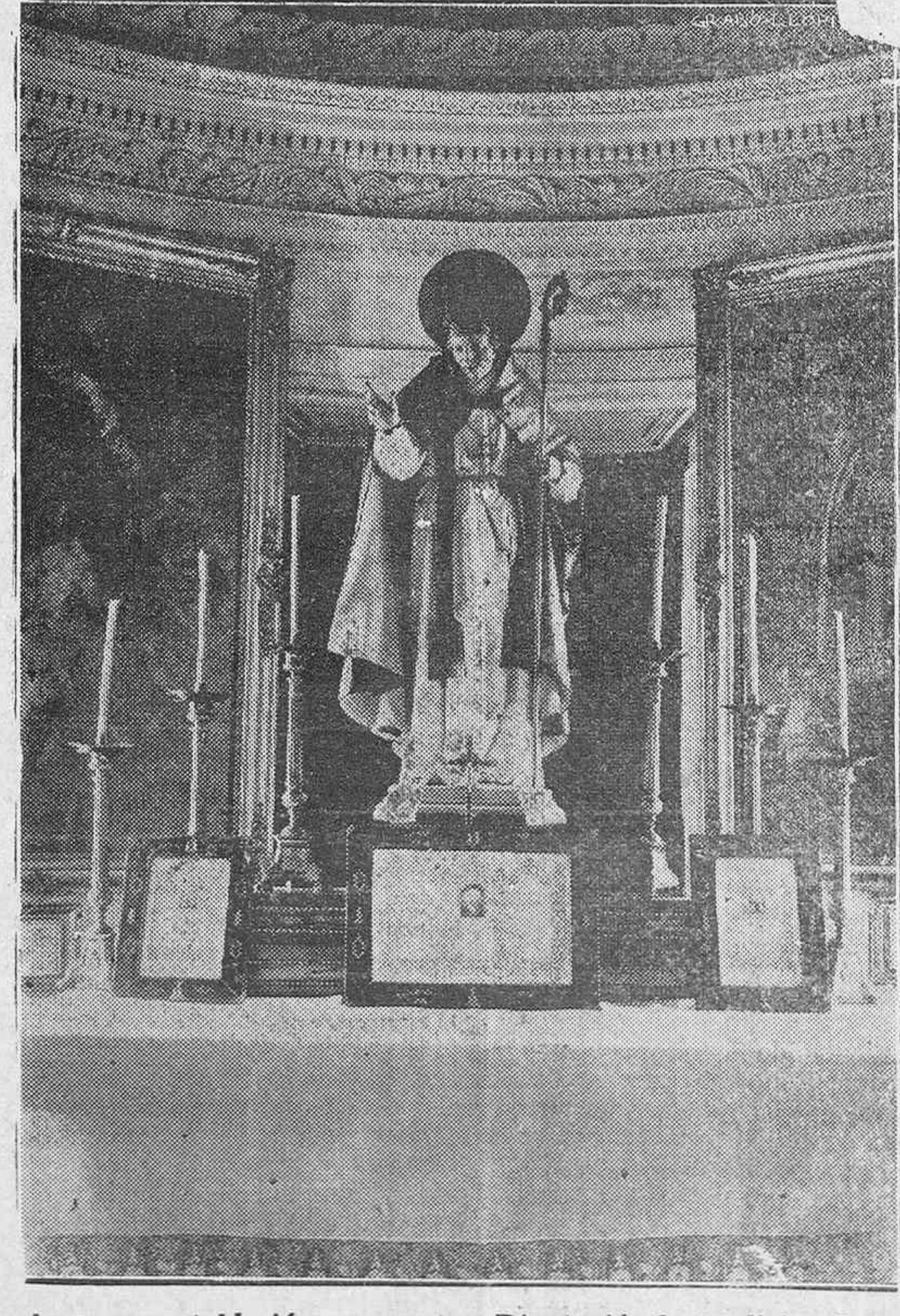
Ayer se restableció por nuestra Diputación la tradicional costumbre de tener la Misa de San Prudencio en este altar de la Capilla Provincial.