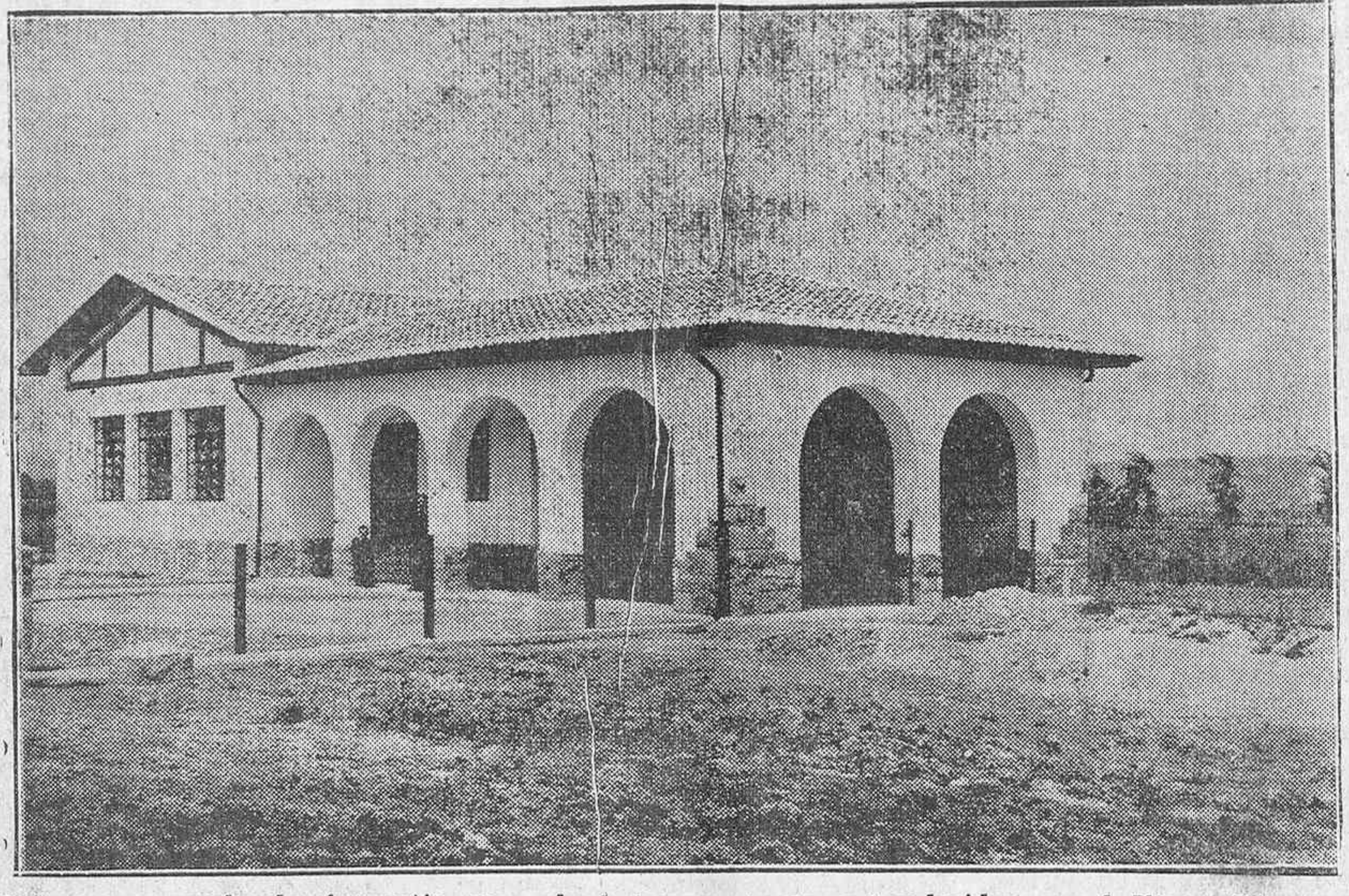
La nueva escuela de Armentia, muy elogiada ayer tarde, y bendecida por el Ilmo. Vicario General.