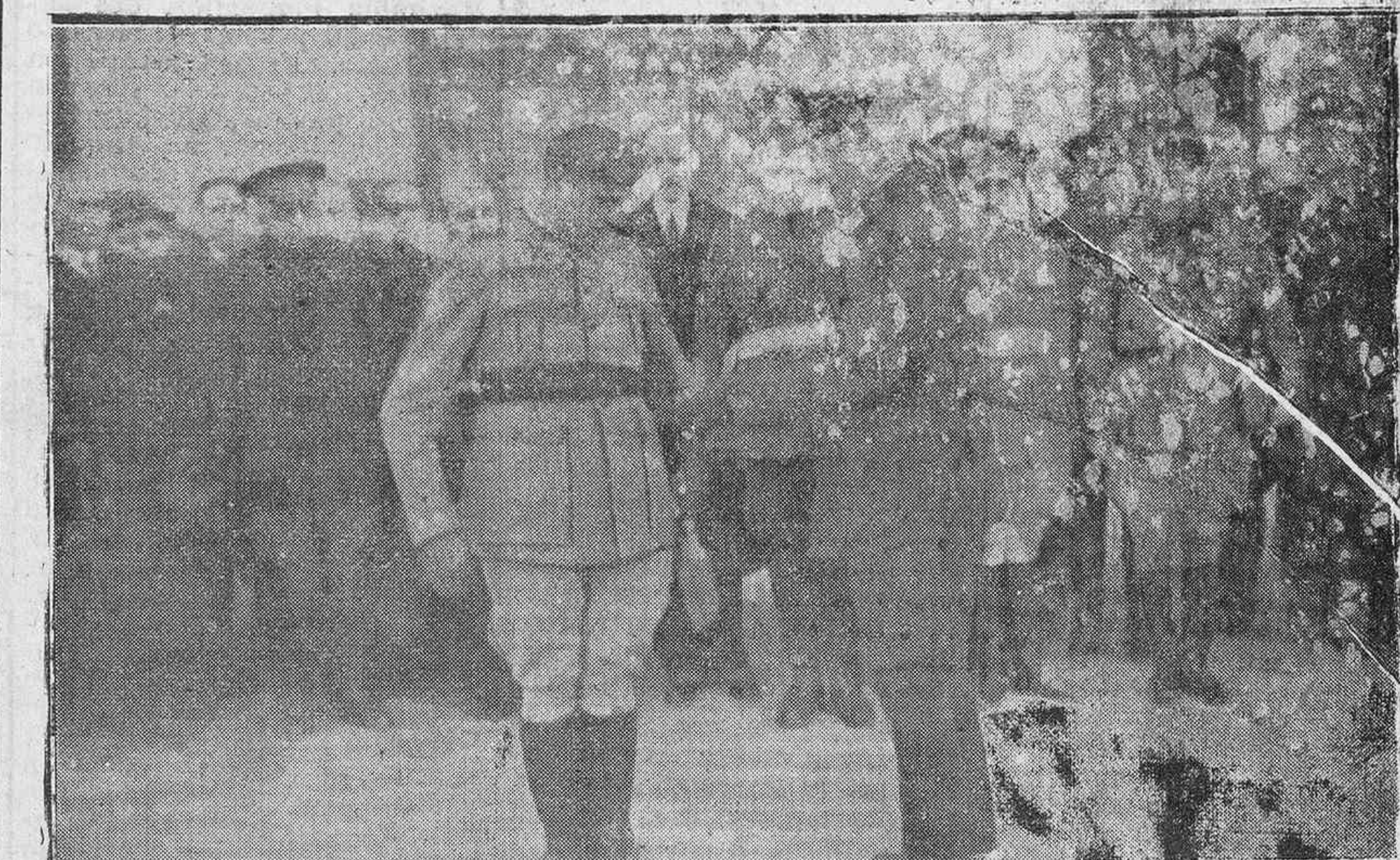
El general de la División, señor López Pinto, imponiendo esta mañana el fajín de general al heroico coronel Solchaga. (Foto Salinas).

sentación de la Milicia Ciudadana y los niños de las Escuelas Municipales con sus profesores y maestros.