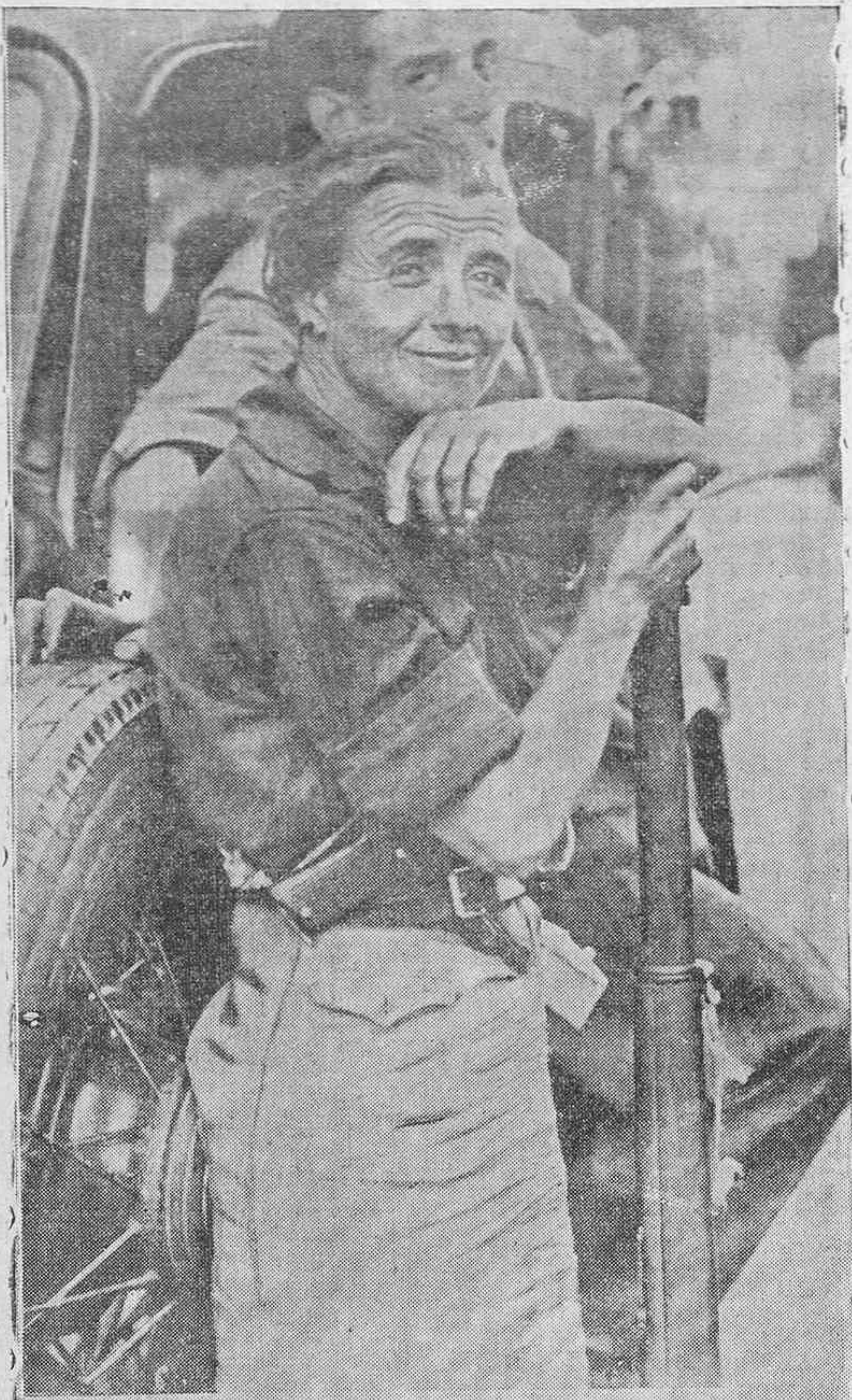
AMAZONS OF THE REVOLUTION. One of the leaders of the Volunteer Women's Militia in Madrid called upon to defend the capital against the Fascist insurgents. The general arming of the populace by the Republican authorities hastened the state of affairs, resulting in the conditions of the French Revolution. It will be noted also that in the picture received from Bugnos some of the forces of the Right are also carrying arms without wearing a military uniform.

Cuando los "gudaris" realizan un ataque, la blasfemia no se separa de sus labios. En Villarreal—según un "gudari" que tomó parte en el combate—tuvieron las milicias anarco-separatistas más de 7.000 bajas. El "gabón" del gudari se quedó tan a retaguardia, que las milicias nacionalistas no cenaron la noche de Navidad. Cómo se hacen los ascensos en Bilbao