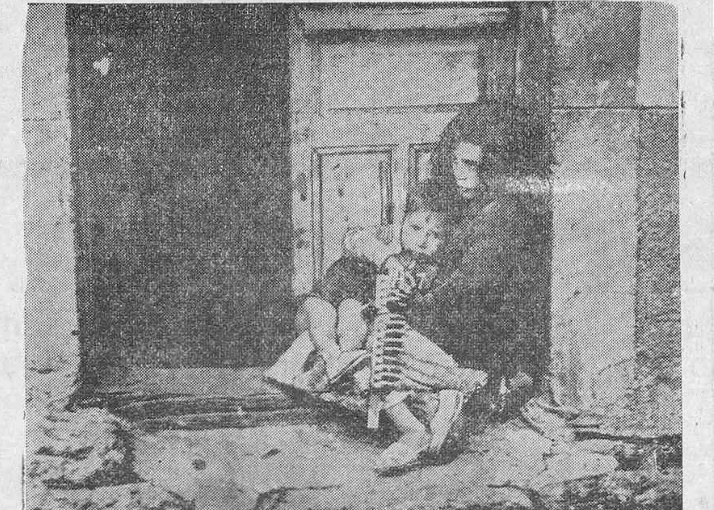
ORPHANS OF THE STORM. A tragic picture of a young Spanish girl sheltering with her baby brother in a broken doorway. They were the only remaining inhabitants of Kobregord, which at different times has been shelled, both by rebels and loyalists. Nunca ha habido en Madrid tanta miseria como ahora. Hasta que el ejército libre a la capital de España, este cuadro de los niños en los quicios de los portales, sin su madre y sin pan, será el espectáculo de todos los días y de todas las calles.

Y que en la fecha más alta de sus calados crestones—sol de anhelos y oraciones—relumbre la Santa Cruz.