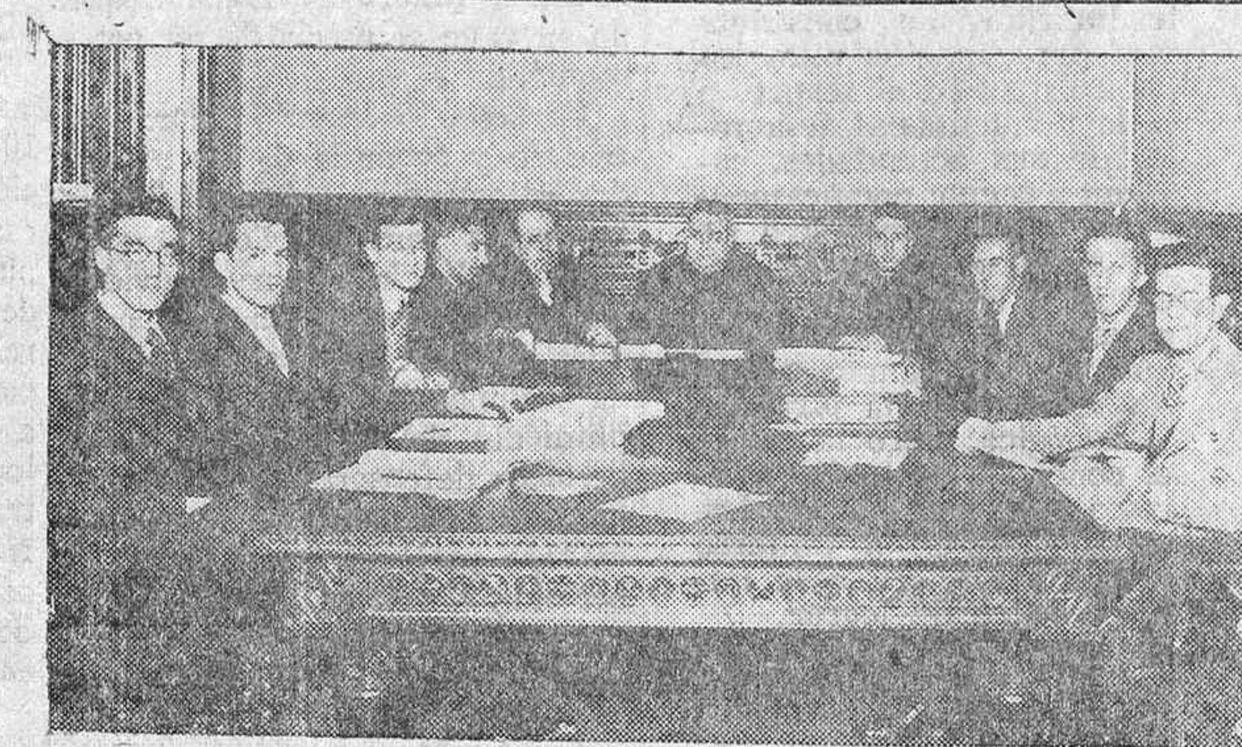
JUNTA PLENARIA de la "UNION VASCA DE ESTUDIANTES CATOLICOS" Bilbao, 13 de enero de 1935.