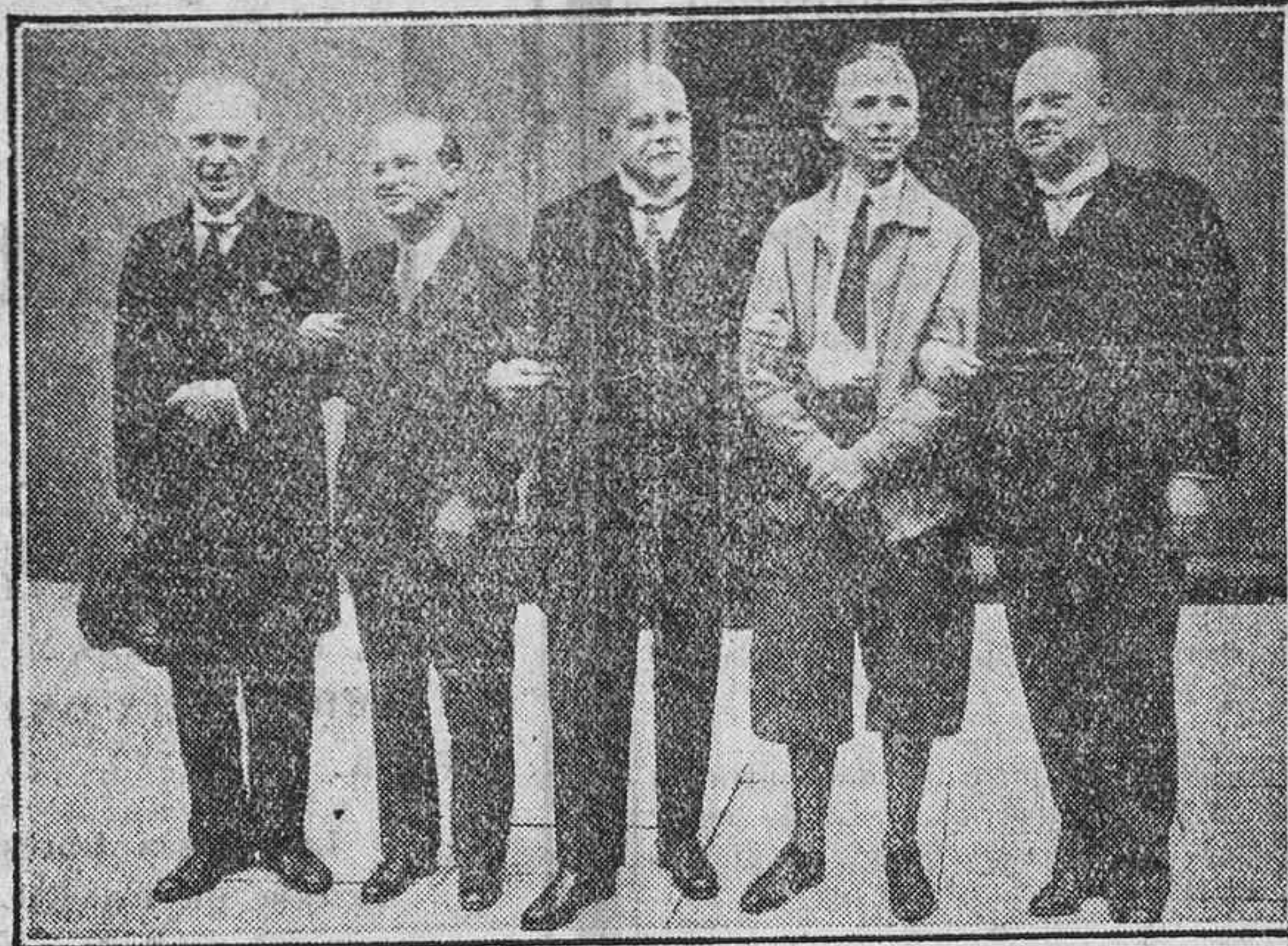
EN EL PALACIO PRESIDENCIAL DE BERLIN

Hoy celebra su fiesta onomástica nuestro respetable amigo el M. I. se-