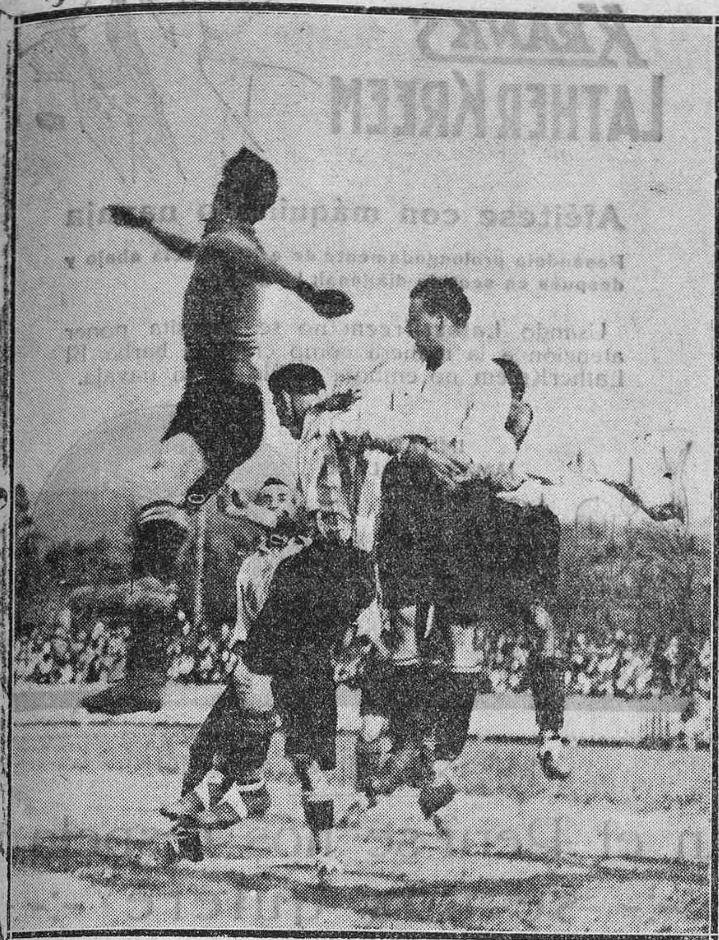
EL ACOSO DE NUESTROS DELANTEROS A LA PUERTA ERANDIOTARRA.