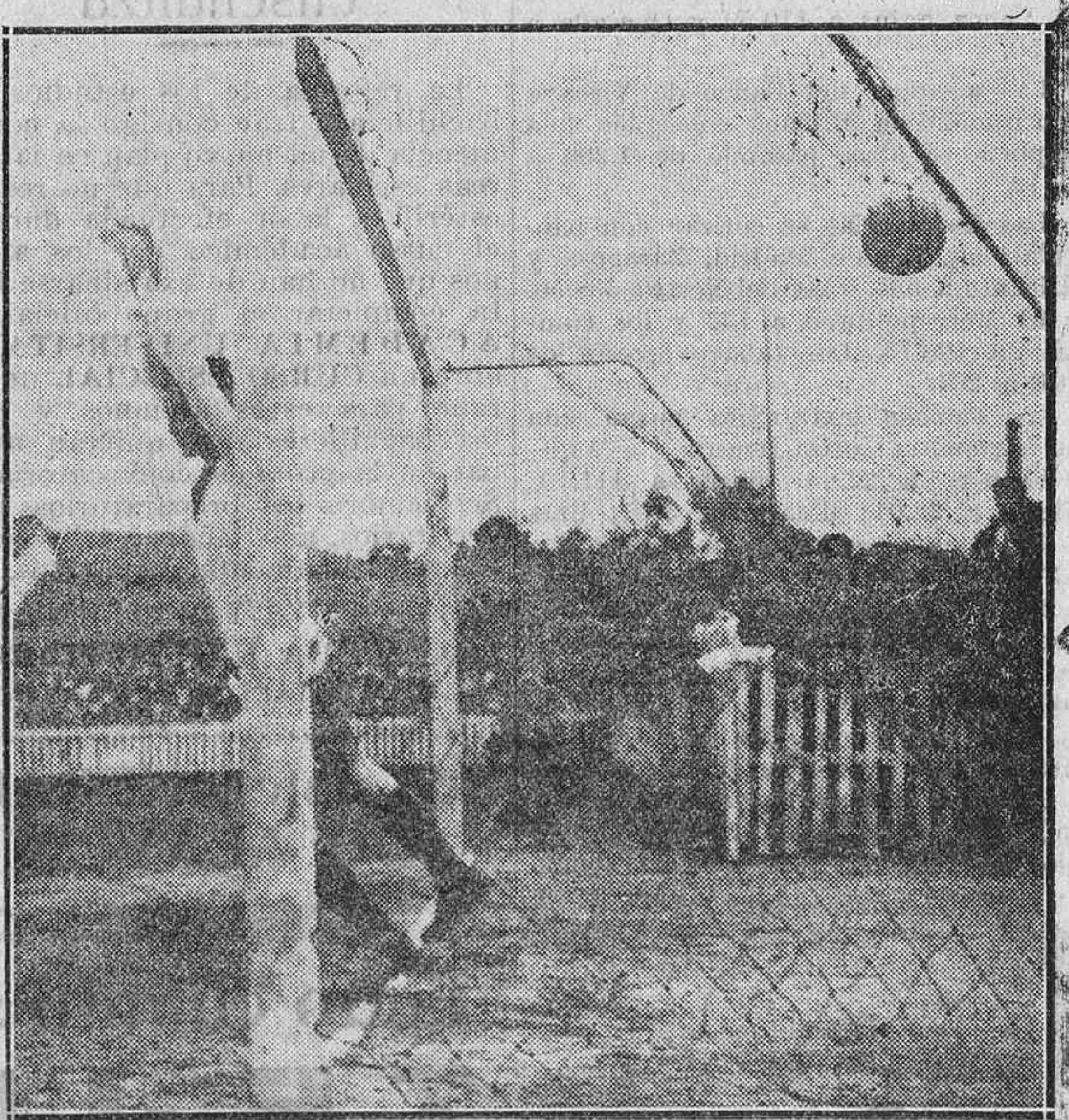
UNO DE LOS TANTOS DEL ERANDIO