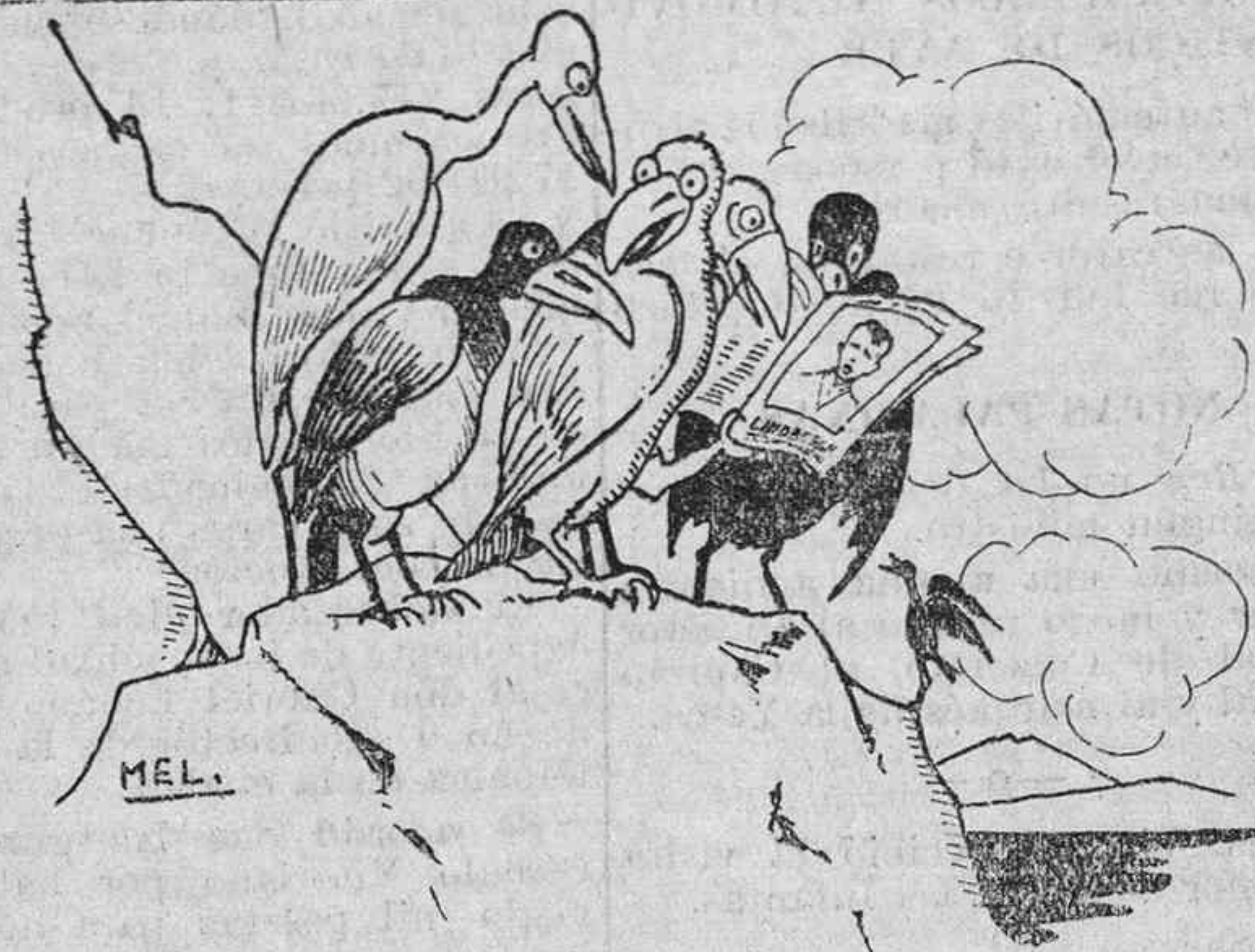
EN EL REINO DE LOS AIRES

Ha hecho «La Popular» un cartelito que a la afición, ha abierto el apetito. Y de todos los pueblos de la tierra, bien sea por la radio o por escrito, se pide el consiguiente billeteito con la adición: ¡Y Chocolate Ezquerri!