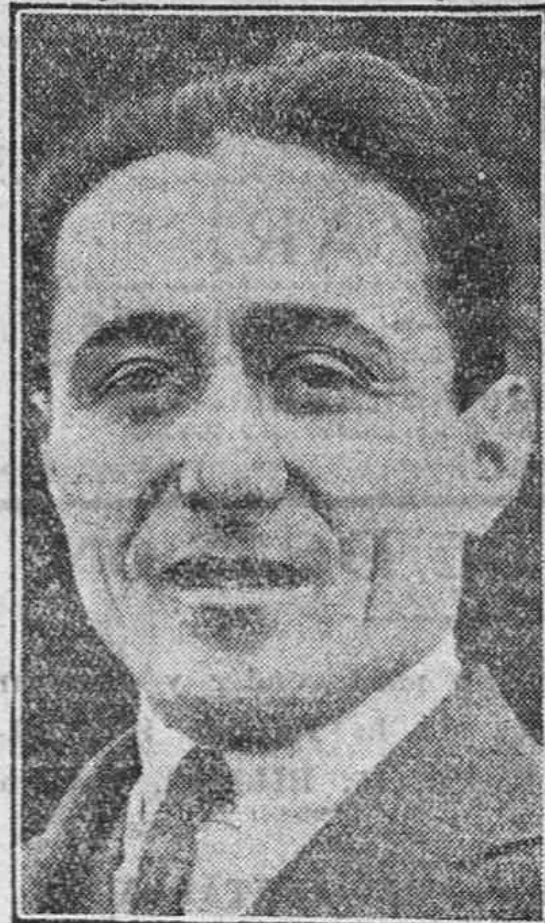
EL AVIADOR COSTES

Agentes: E. Alava y Comp.ª-Independencia, 13.-Tel.º 477