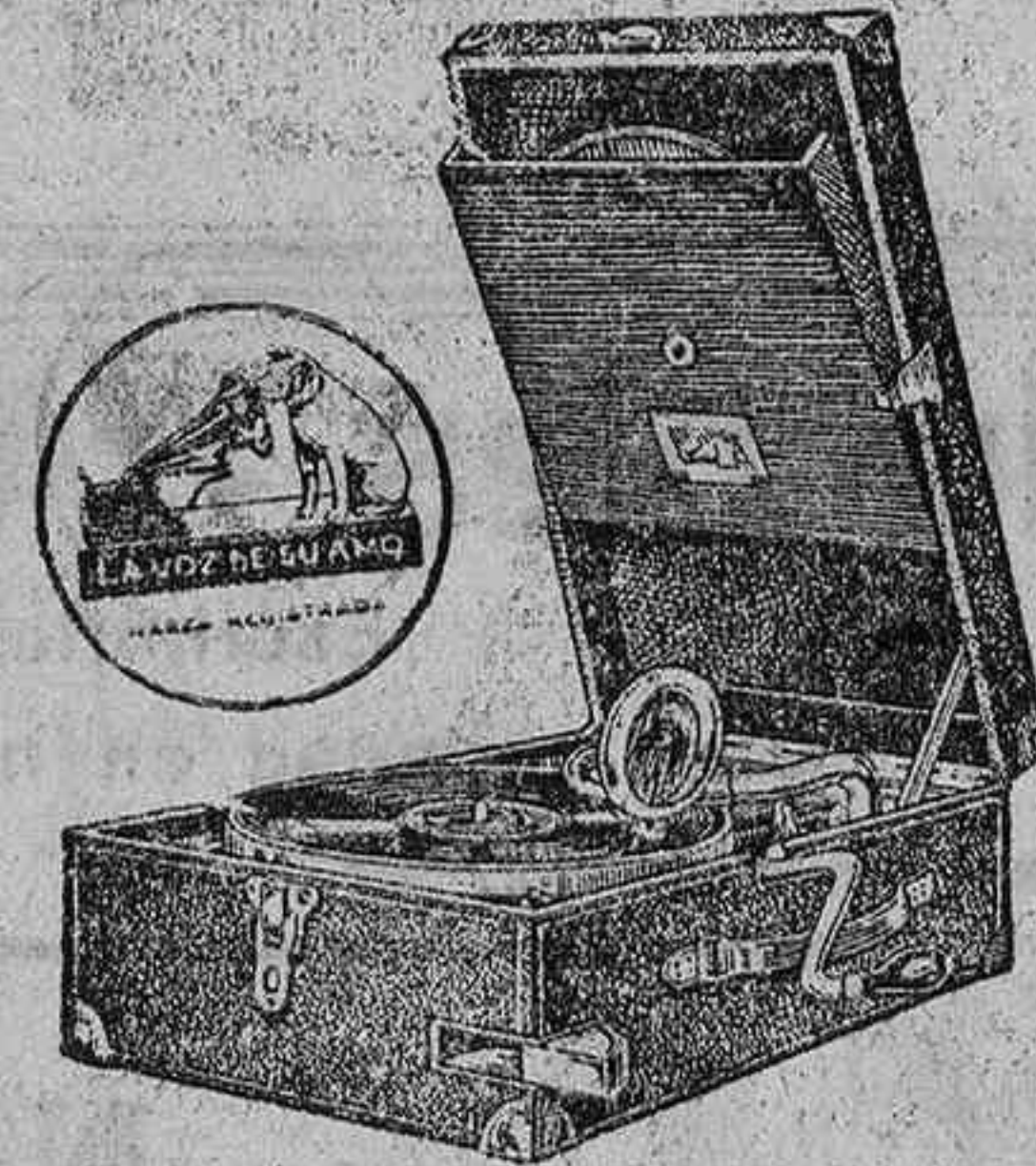
PORTATILES últimos modelos DISCOS toda novedades.

Como, en vista de órdenes de la Superioridad, fueron prohibidas, los mozos solicitaron que la cantidad consignada para aquella