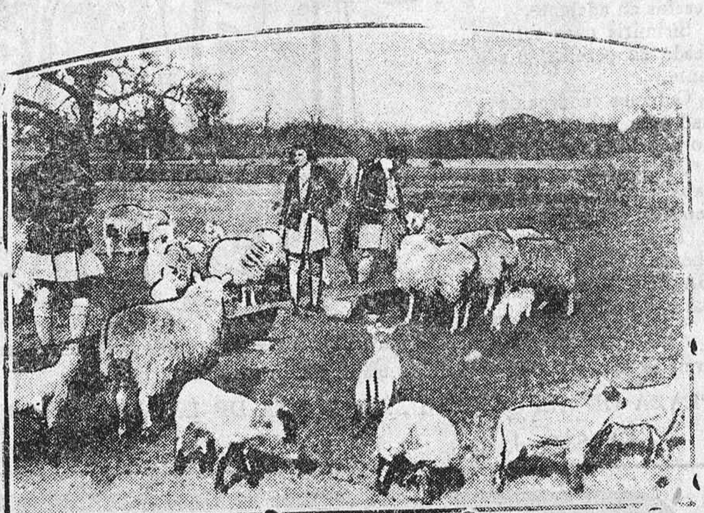
En Londres ha sido inaugurada una universidad agrícola. Dotada con grandes terrenos y recursos no hay que dudar que pronto ocupará un lugar importante entre las de su especie.

En el ministerio de la Gobernación ha estado el gobernador