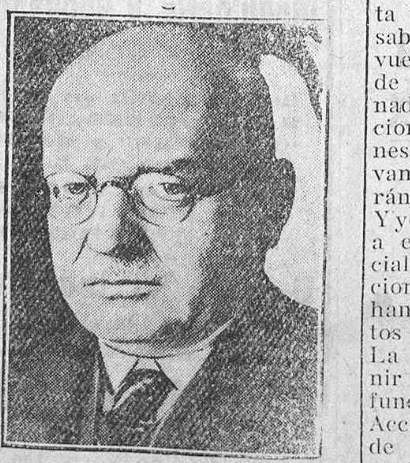
Se rumorea que Luther ex canciller del Reich, será el sustituto de Schacht en la presidencia del Banco del Imperio.

Como veis, se puede asegurar que el principal fundamento de la Acción Católica es intelectual y consiste en una evangelización de la Sociedad, atendiendo sus múltiples facetas. Una evangelización de aquella parte de la Sociedad a donde no ha llegado o en la que ha sufrido alguna crisis la savia del Evangelio. Los hombres, tan injustos siempre con las mujeres, dicen de éstas que tienen