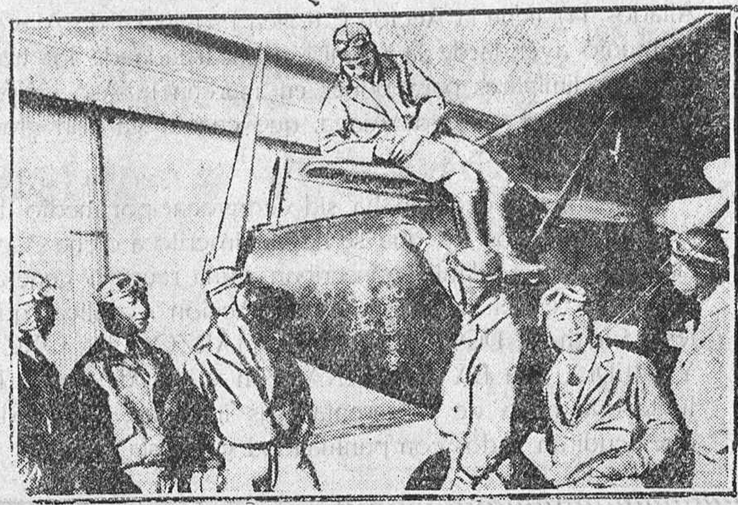
En China hay varias escuelas de aviación dirigidas por oficiales europeos para adiestrar en el manejo de los aviones a los jóvenes indígenas.—He aquí la subvencionada por el gobierno nacionalista chino que está funcionando con gran éxito.