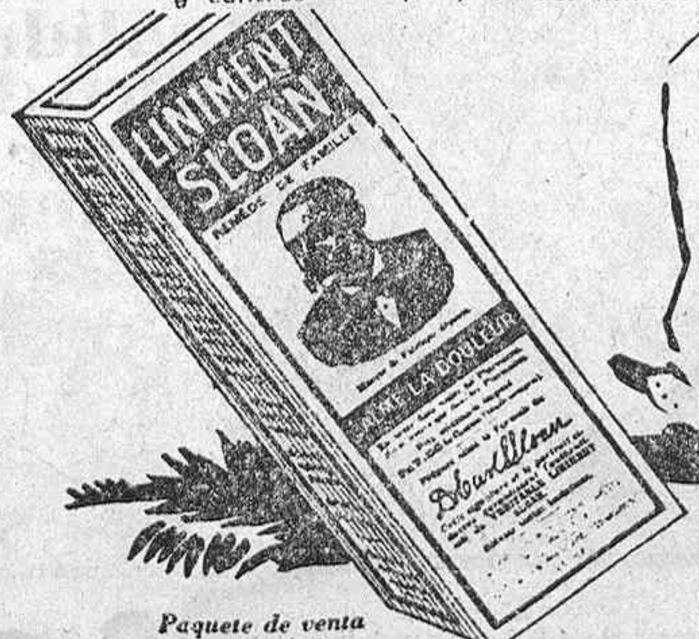
Pequeño de venta en Francia

De venta en las farmacias, droguerías y centros de específicos del mundo.