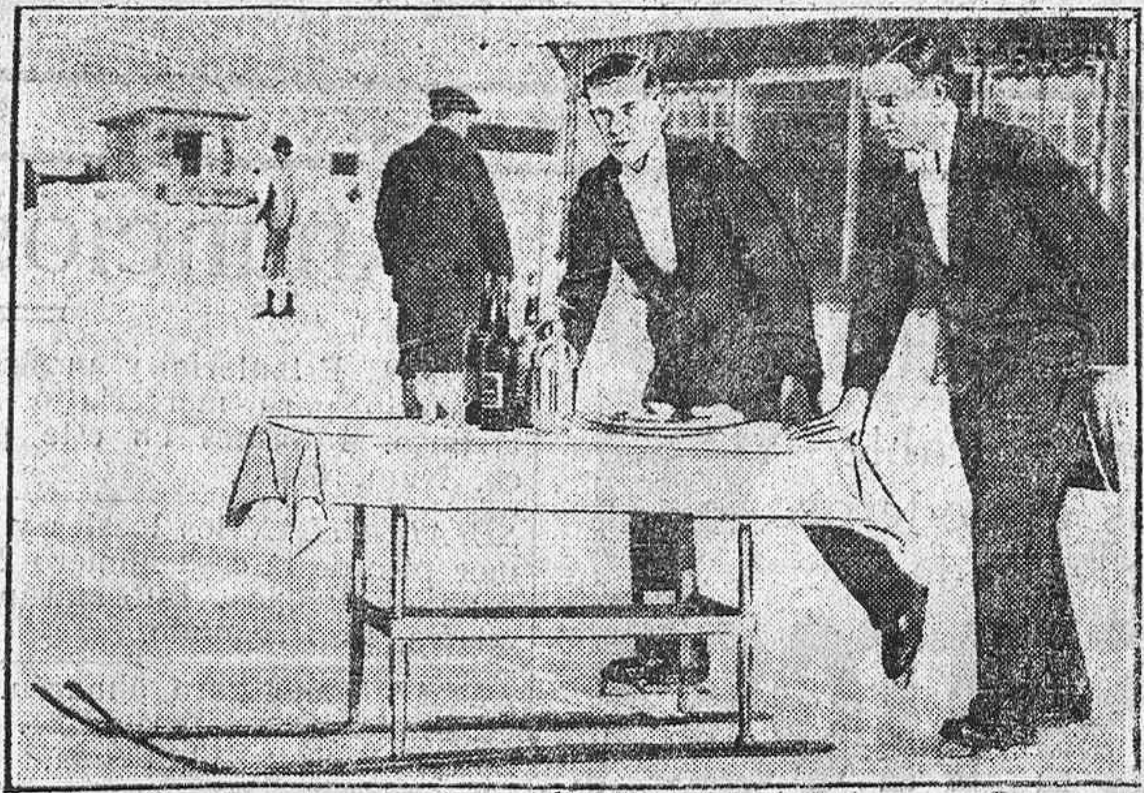
Sobre las pistas heladas de St. Moritz los camareros, excelentes patinadores, sirven los refrescos a sus clientes, los que practican los deportes de nieve en tan bella localidad suiza.

EMILIO P. DE NEGURI. (Colaboración de la Federación de Asociaciones de la Prensa del Norte y Noroeste de España.)