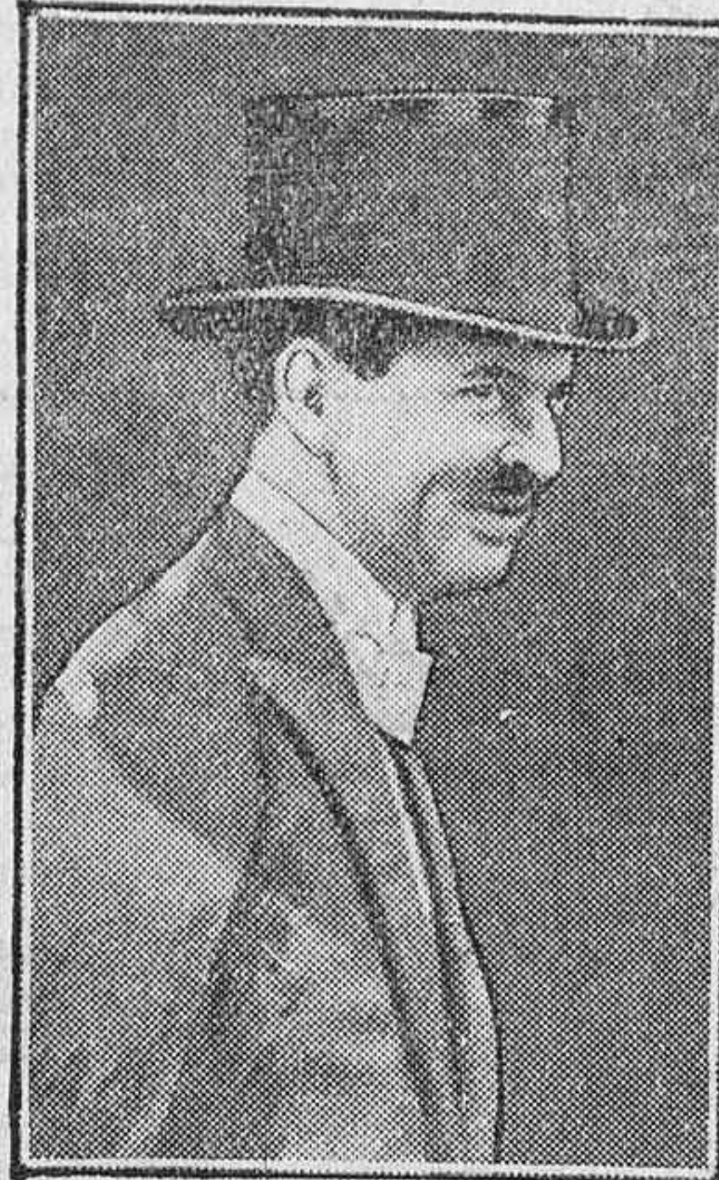
EL PRINCIPE CAROL

hace pocos días dejando un pasivo de dos millones de pesetas.