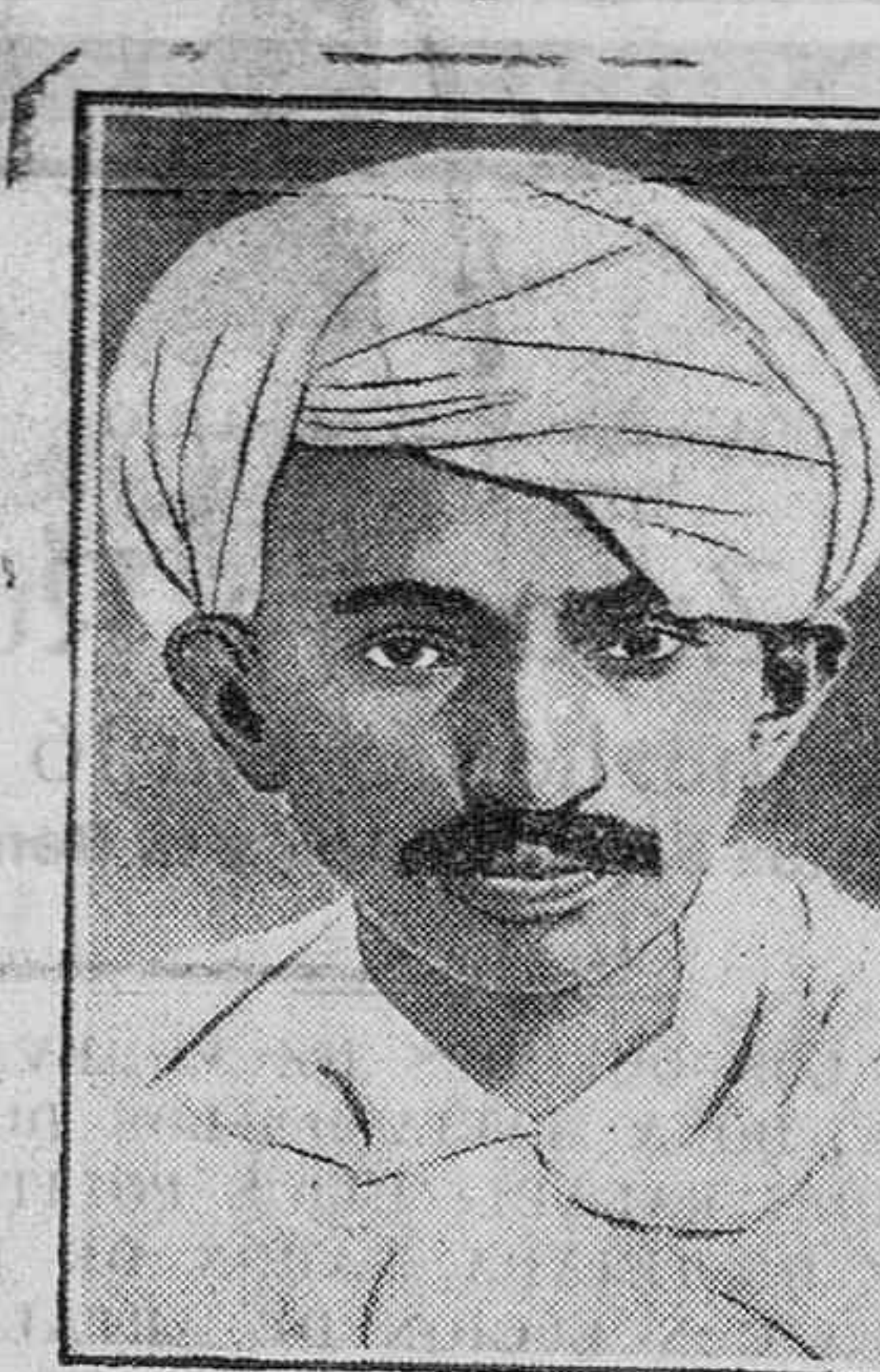
El jefe del nacionalismo indostánico, Gandhi, muy venerado por sus partidarios, que se halla gravemente enfermo.

creación de Montepíos para los funcionarios con bases mutualistas. Le contesta el ministro del Trabajo diciendo que el Gobierno se ocupa de este asunto. (Continúa la sesión).