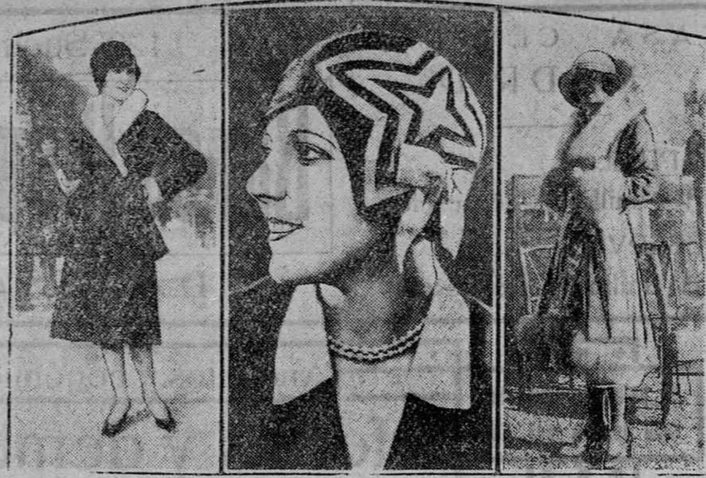
Varios modelos de los abrigos de invierno de las casas parisiñas, que han llamado la atención.