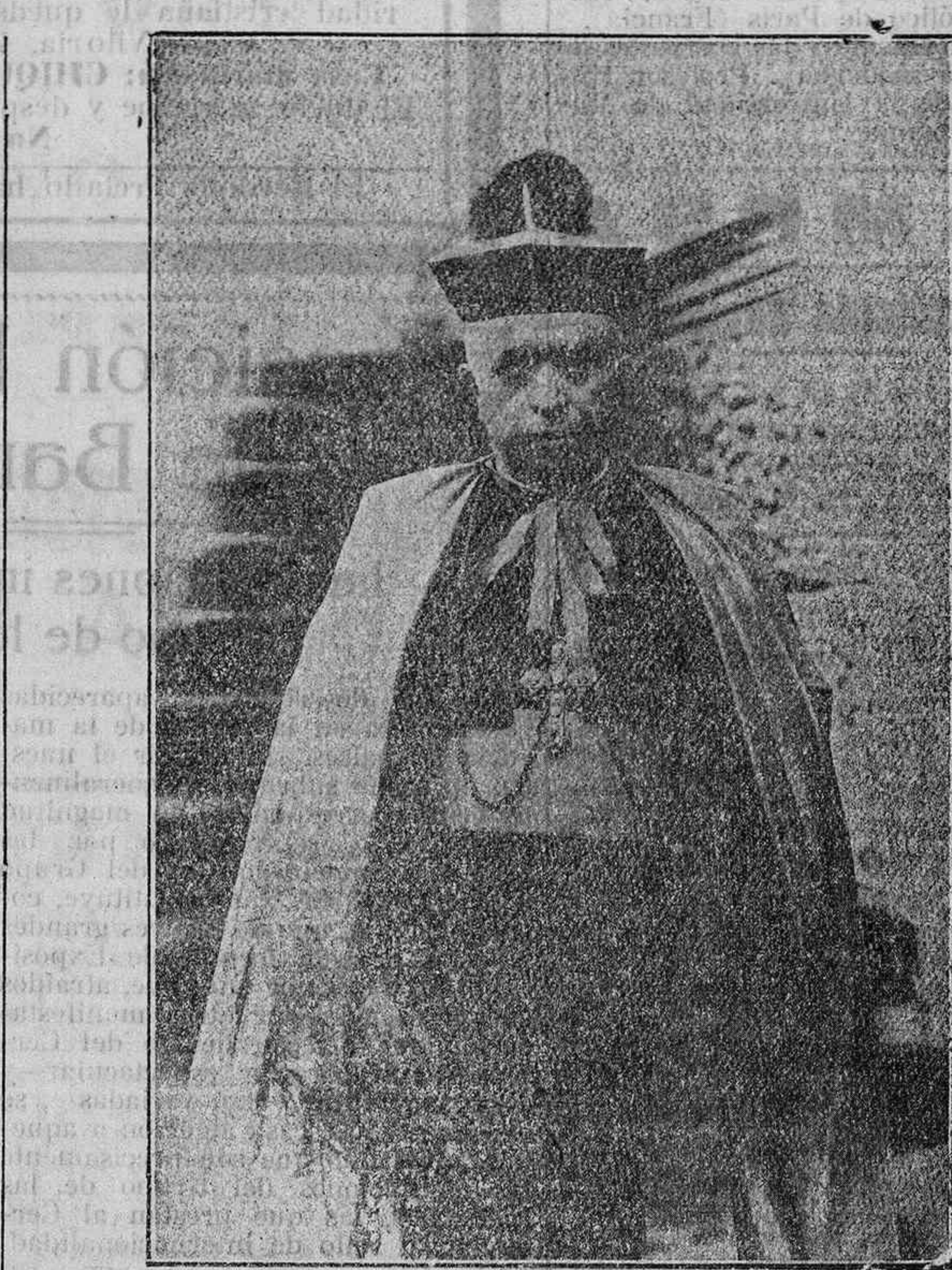
El excelentísimo señor Arzobispo de Santiago.

En el primer volumen que se titula «Discursos y Oraciones Sagradas» han publicado los editores, por este orden, los siguientes trabajos: el artículo «Tu es Petrus», acabada semblanza del inmortal Pontífice León XIII como hombre y Vicario de Cristo; La Providencia de Dios en el mundo microscópico , luminoso estudio de la célula, «madre y depositaria de la vida orgánica», en el que después de refutar las teorías de Haeckel y describir a maravilla las actividades prodigiosas de la célula con sus elementos constitutivos del protoplasma, de la membrana y el núcleo, viene a probar que «la vida supone vida y no hay vida sin Dios»; las Oraciones Fúnebres de Felipe II e Isabel la Católica , en la primera de las cuales, llamada acertadamente por el insigne Orador «Oración fúnebre de España», con inmensa copia de argumentos, contribuyó a la vindicación histórica de este calumniado Rey, «el más grande de los Monarcas de la tie-