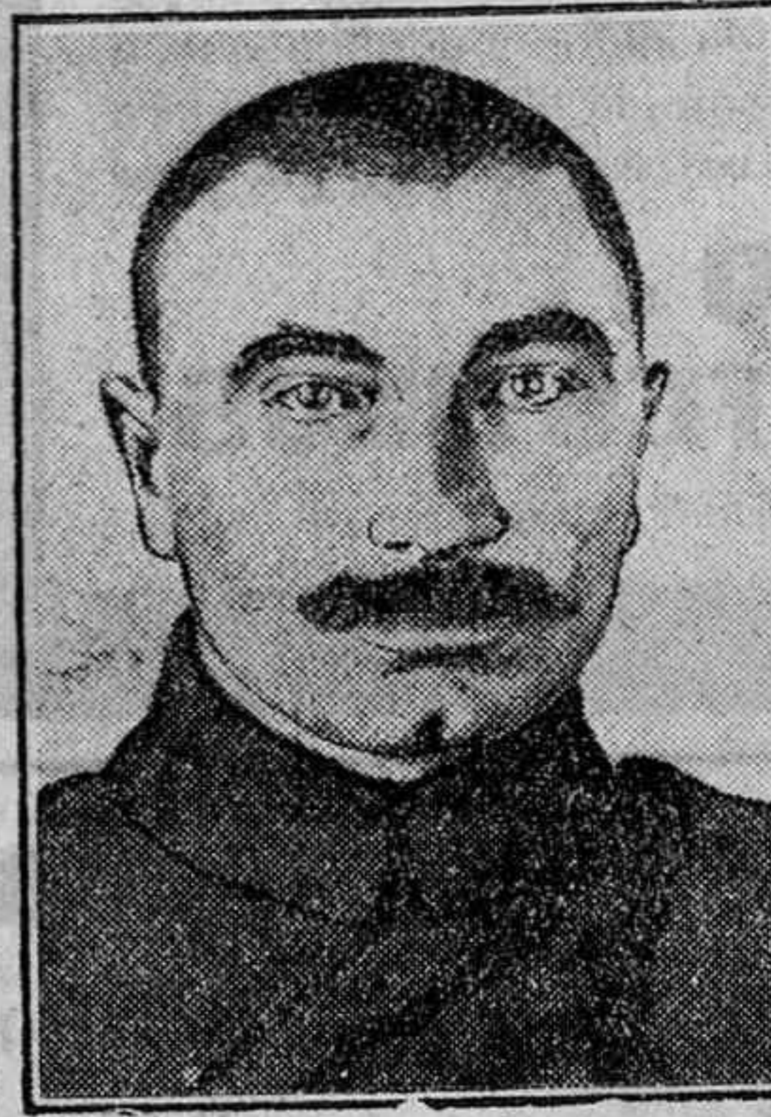
Del conflicto ruso-chino

En la reunión de esta tarde se procederá al nombramiento del Comité Nacional.