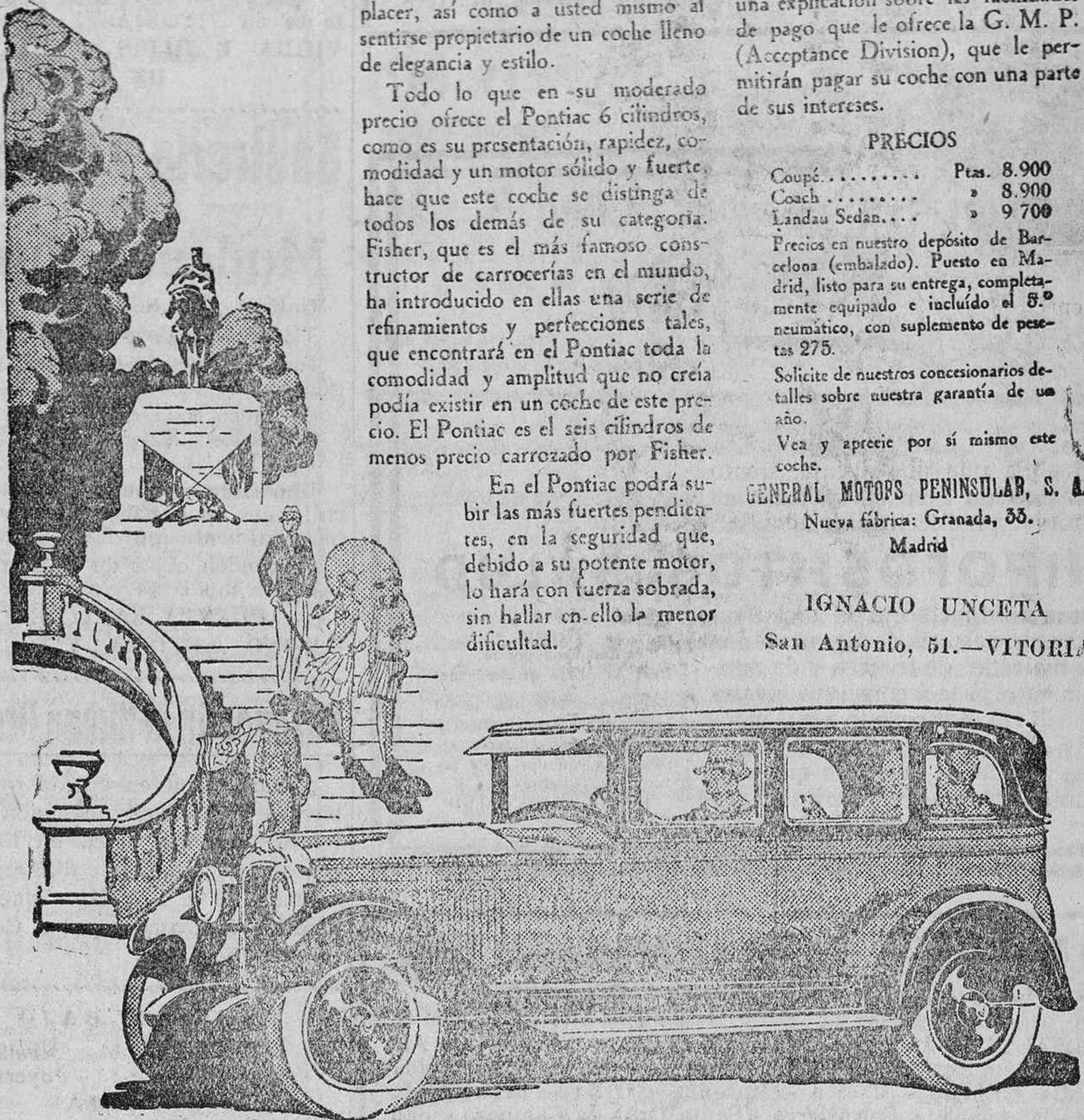
La distinción del Pontiac entusiasma a todo el que lo ve