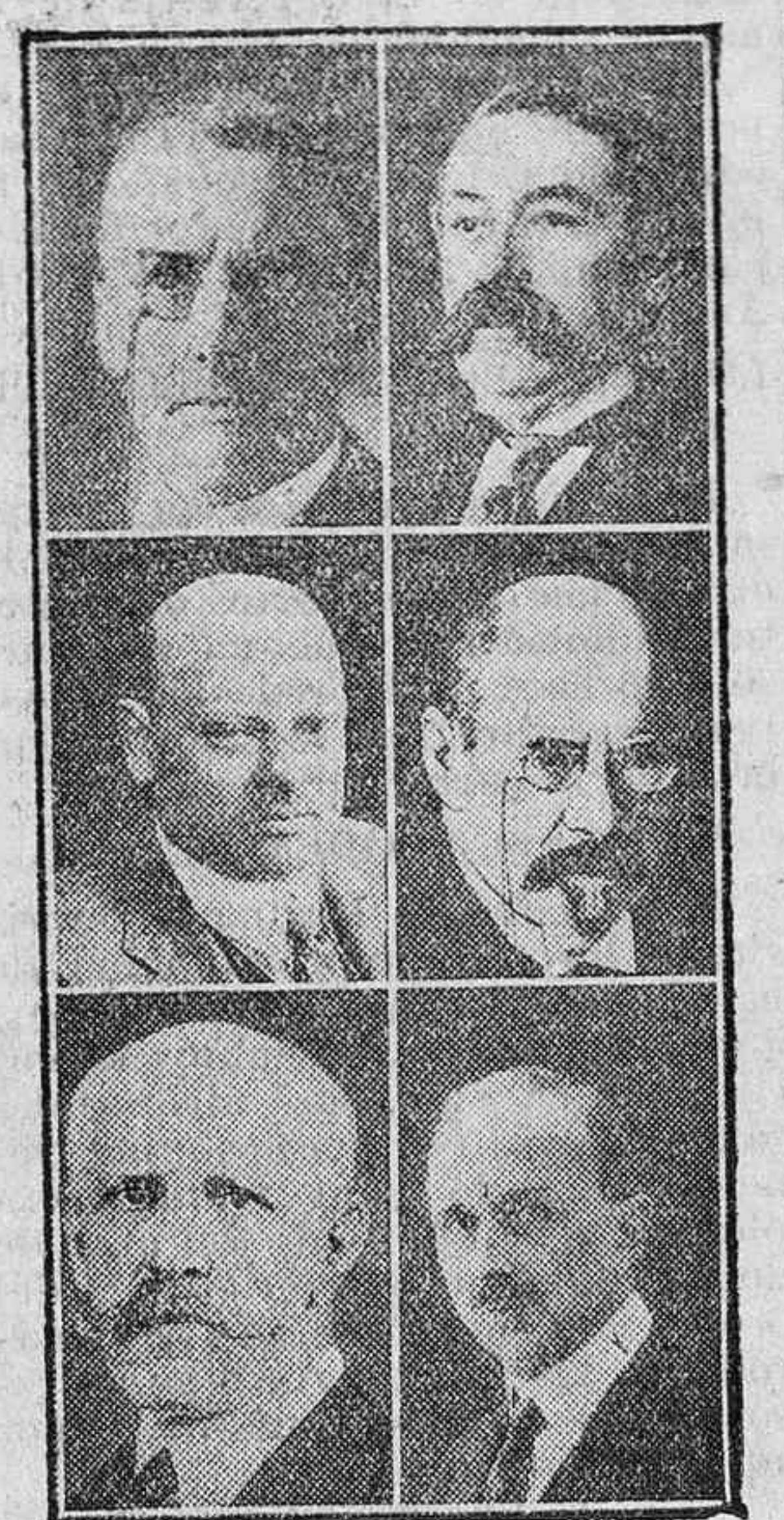
LA SOCIEDAD DE LAS NACIONES