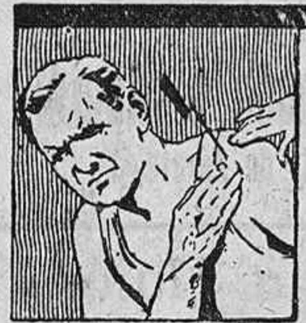
mata el dolor más agudo

Por fin el «C. E. F.» en el extranjero posee derivaciones en las capitales donde existen Cámaras de Comercio Españolas; donde tenemos nombrados «attachés» comerciales; donde las colonias españolas son importantes y donde nuestro Patronato de Turismo sostiene sus delegados. El «C. E. F.» es una Institución modelo que honra a España y que puede rendir incontables beneficios a nuestro trabajo y a nuestra riqueza.