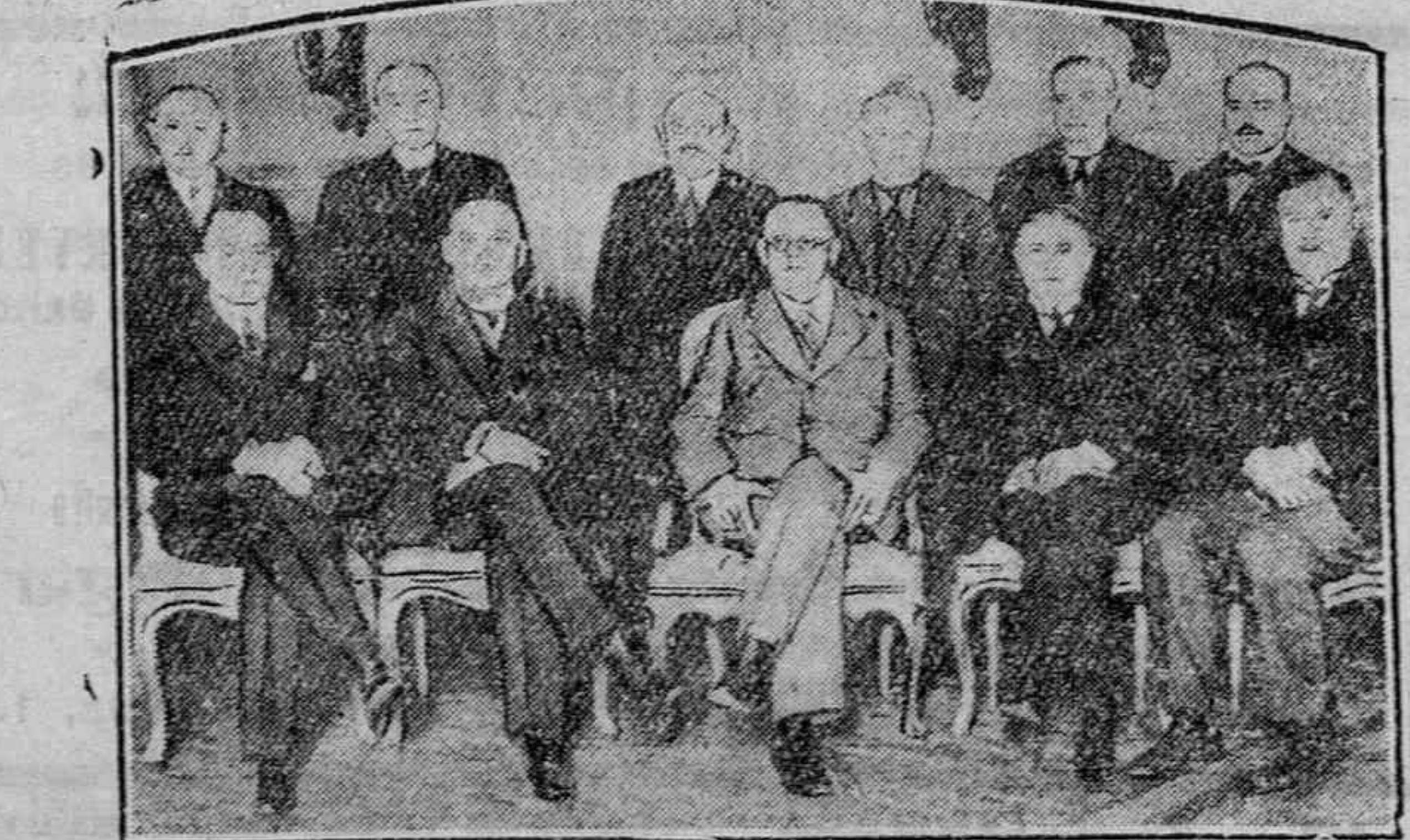
LA REUNION DEL NUEVO GOBIERNO ALEMAN

Hemos leído en un diario de la Corte la breve reseña que su corresponsal en Vitoria hace del último partido jugado por el Deportivo contra el Betis. En esa reseña se dice que el equipo local demostró falta de entrenamiento y, es los jugadores, especialmente Antero. Respetamos la opinión del crítico aludido pero no estamos conformes con ella. Ni el equipo del Deportivo demostró falta de entrenamiento ni mucho menos Antero. Tanto al equipo como a su capitán se les puede imputar otros defectos, pero falta de entrenamiento no. Al equipo, por ejemplo,—hechas las excepciones necesarias—le faltó entusiasmo, coherencia, afán de destruir el juego preciso contrario, tan fácil de anular con un poco de fogosidad, pero no una fogosidad estilo San Martín, buscando el choque con el contrario, sino una fogosidad que se suele llamar «chambre de balón». Este defecto del equipo vitoriano puede consistir precisamente en el entrenamiento. Ya es sabido que la mayoría de los equipos bien entrenados no ven casi el balón durante la semana mientras que los jugadores se preparan en velocidad, en agilidad, con siltos, carreras de velocidad—sprints—y de resistencia—varias vueltas al campo a tren sostenido—y nada de balón, todo lo más un día en la semana y por breves momentos. De este procedimiento se obtienen excelentes resultados. Los jugadores adquieren flexibilidad y resistencia, tan necesarias para el buen desarrollo del juego. Y la dieta de balón da unos resultados no menos estupendos.