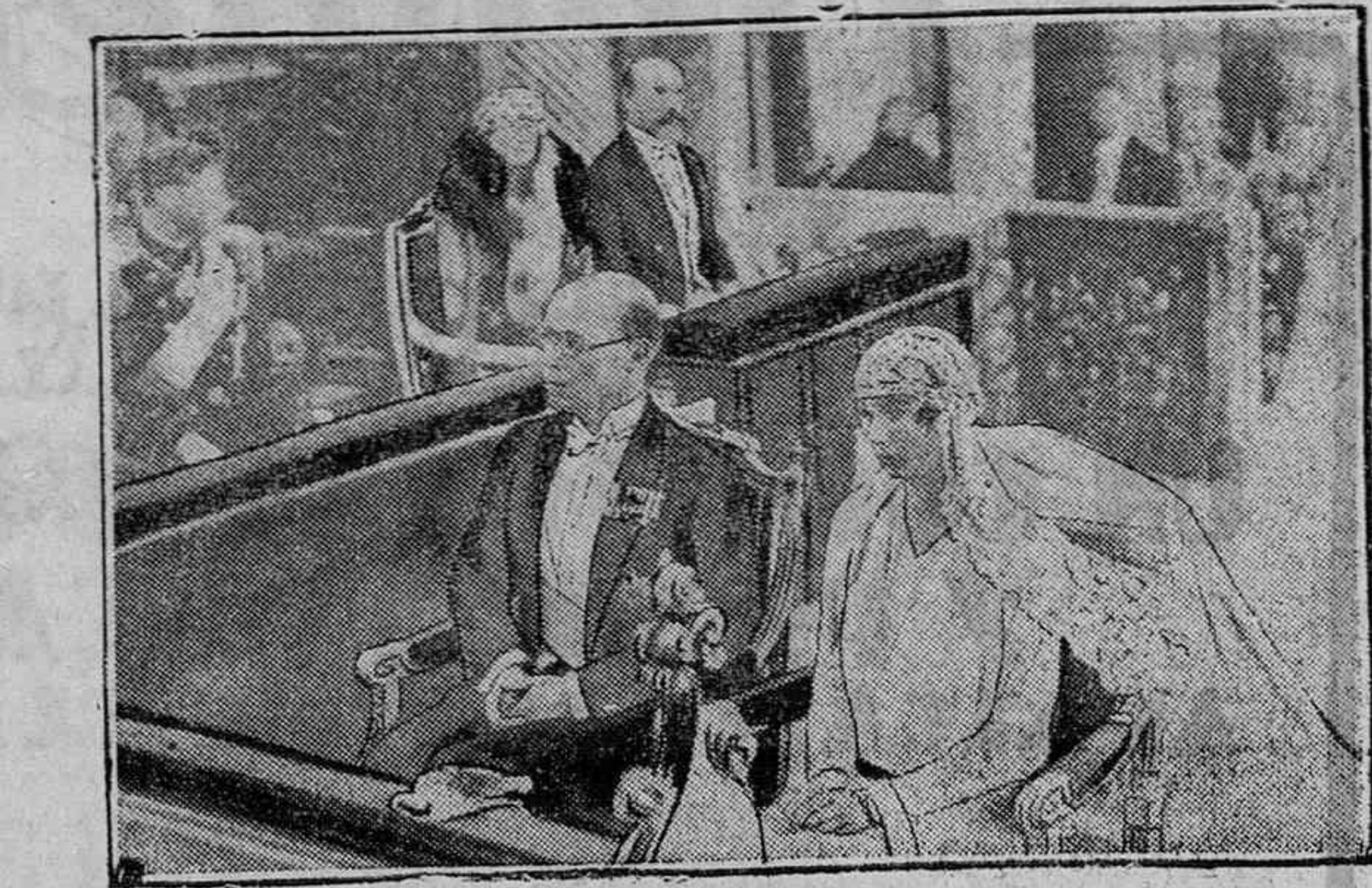
Se acaba de celebrar en Palermo el casamiento de la princesa Francisca de Francia, hija del duque de Guisa, con el príncipe Christophe, de Grecia.—He aquí al nuevo matrimonio, teniendo al fondo el duque y la duquesa de Guisa.

Después de estas lacónicas manifestaciones, el Presidente se metió en el automóvil y se dirigió al ministerio del Ejército.