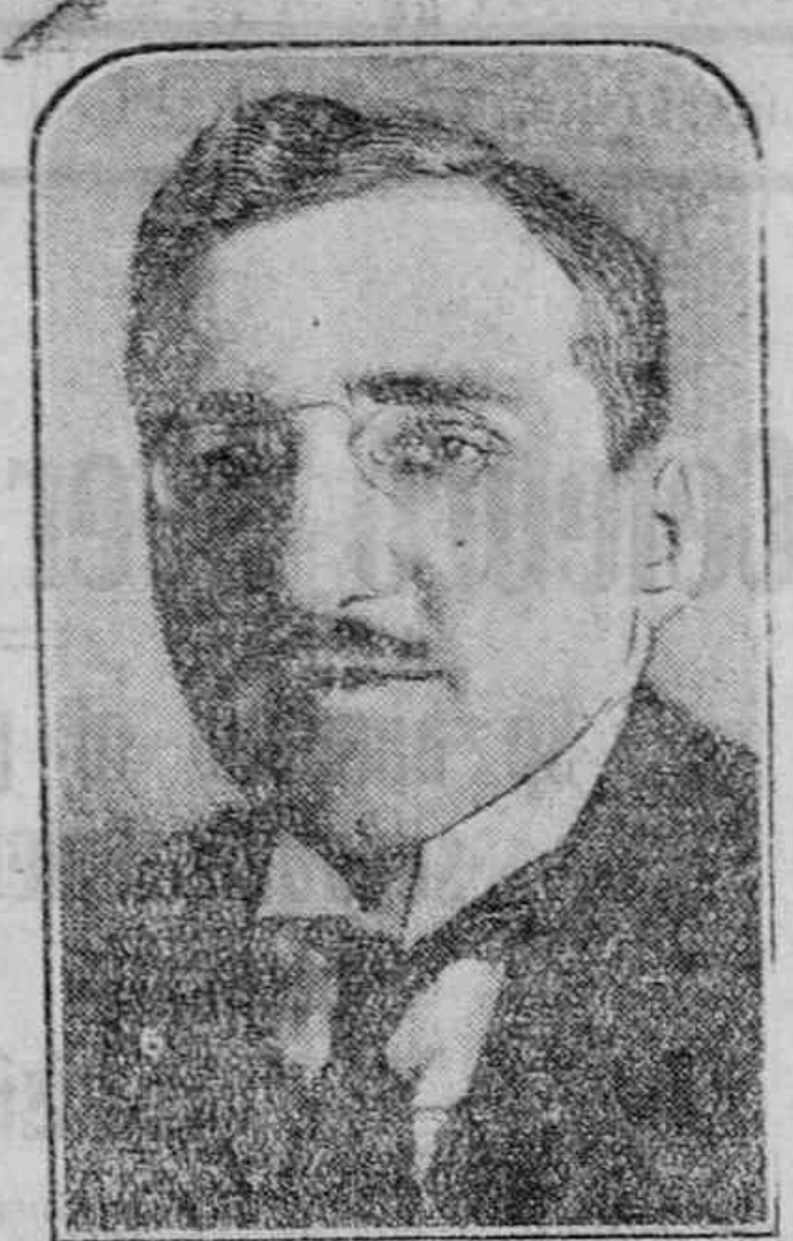
EL REY ALEJANDRO

BELGRADO.—Un periodista ha celebrado una entrevista con el Rey Alejandro, el que ha manifestado que él había sido el primero en esforzarse para evitar el cambio político actual.