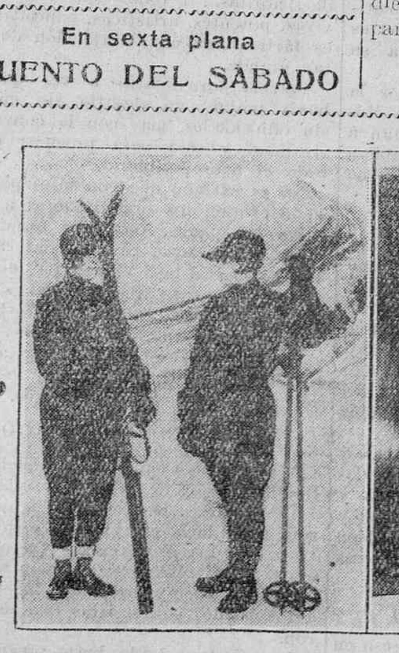
VARIOS MODELOS QUE SE HAN PRESENTADO EN CHAMONIX, PARA EL DEPORTE DE «SKI».