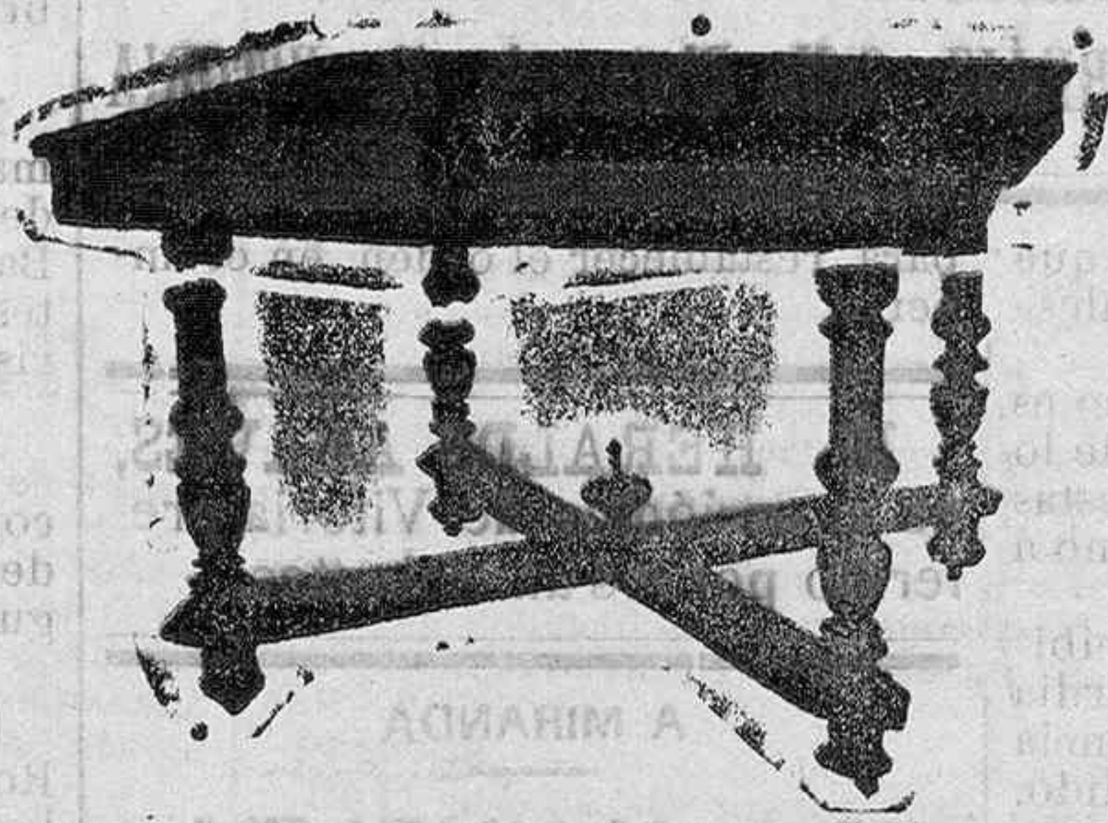
Mesa de comedor nogal