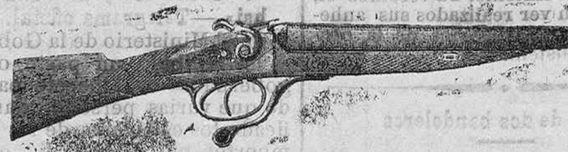
Modelo de escopeta de fuego central dos cañones, á pesetas 145 y 50

Gran surtido en armas de todas clases Accesorios para cazar