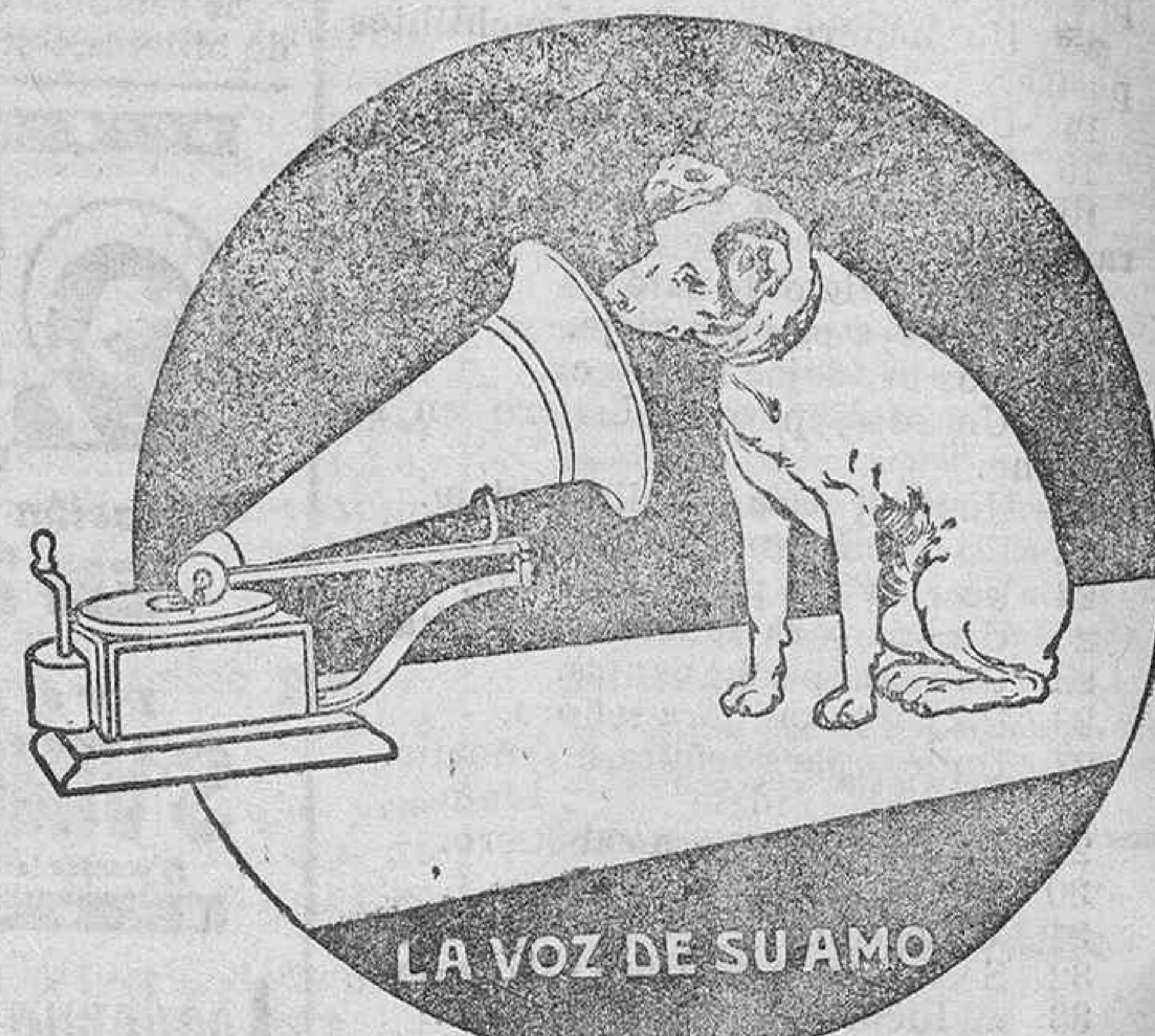
LA VOZ DE SU AMO

EXIGID y buscad en todos los aparatos y discos «GRAMOPHONE» nuestra célebre marca de fábrica «LA VOZ DE SU AMO» y la palabra «GRAMOPHONE» que únicamente nosotros podemos usar por ser de nuestra propiedad exclusiva, y sin cuyos requisitos no adquiriréis un legítimo «GRAMOPHONE».