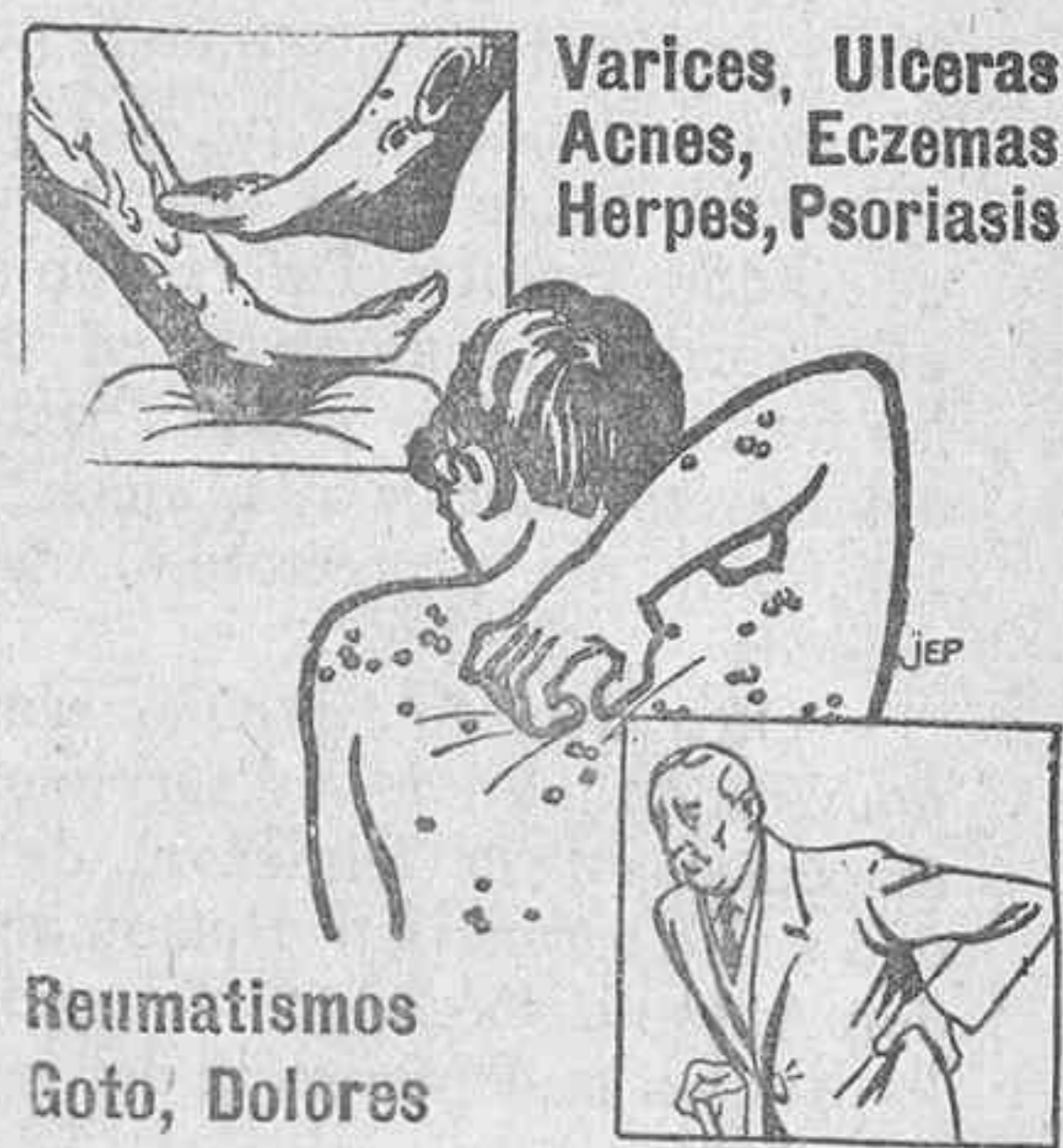
Varices, Ulceras Acnes, Eczemas Herpes, Psoriasis