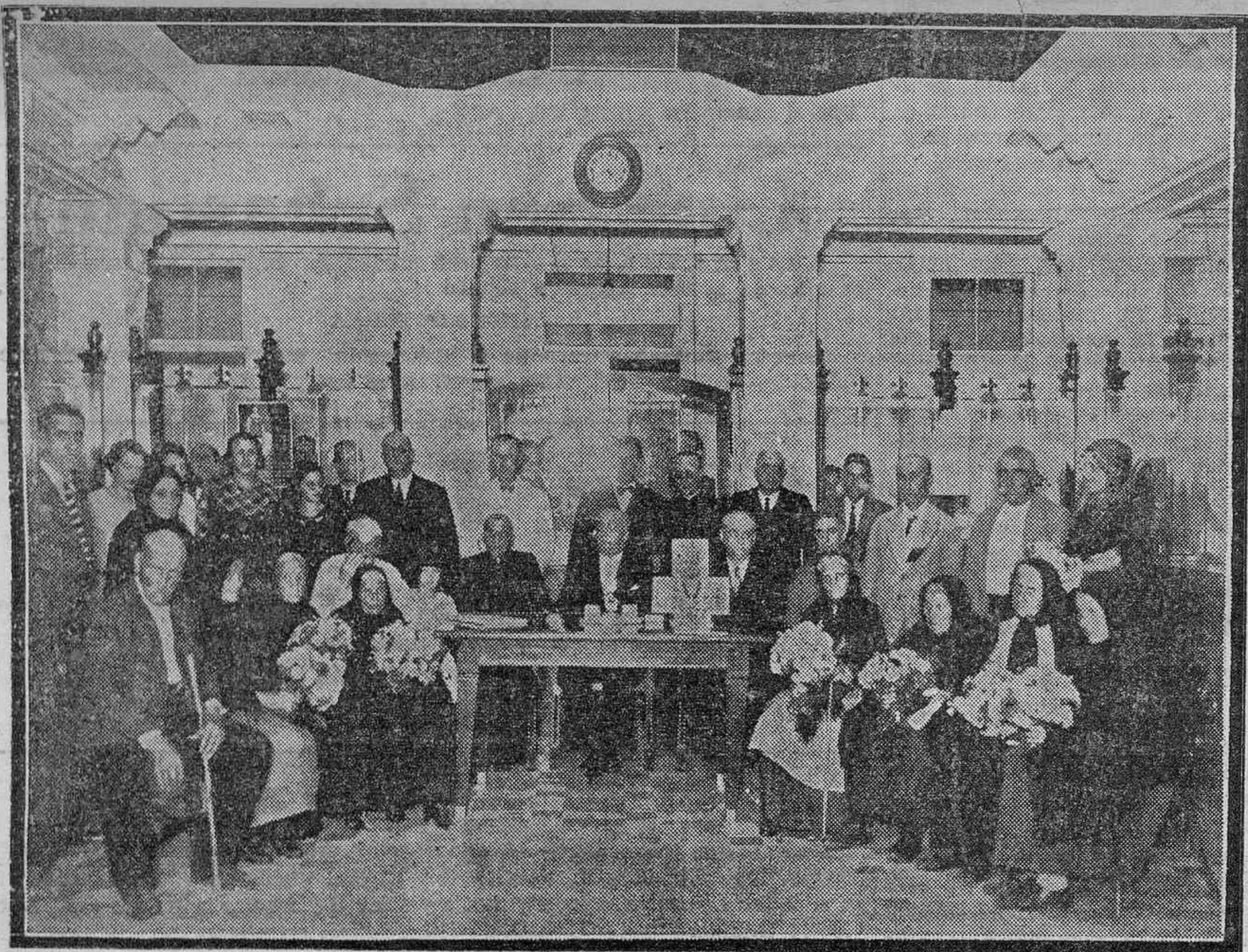
Las autoridades presidiendo el acto celebrado antayer en la Caja de Previsión Social, en el que se rindió homenaje a los ancianos a quienes acaban de conceder pensiones.