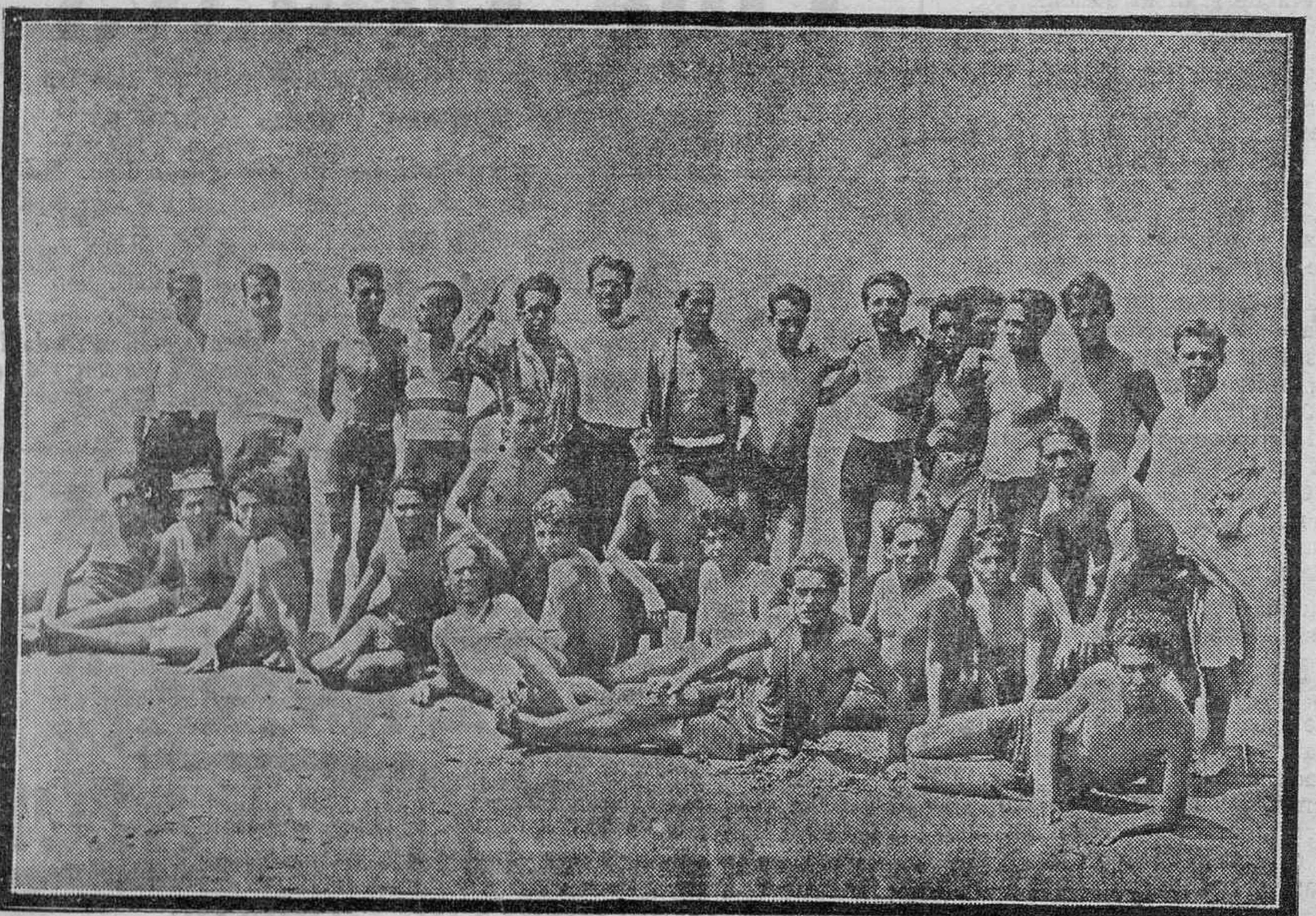
Grupo de jóvenes excursionistas de Santa Cruz en la playa del Médano