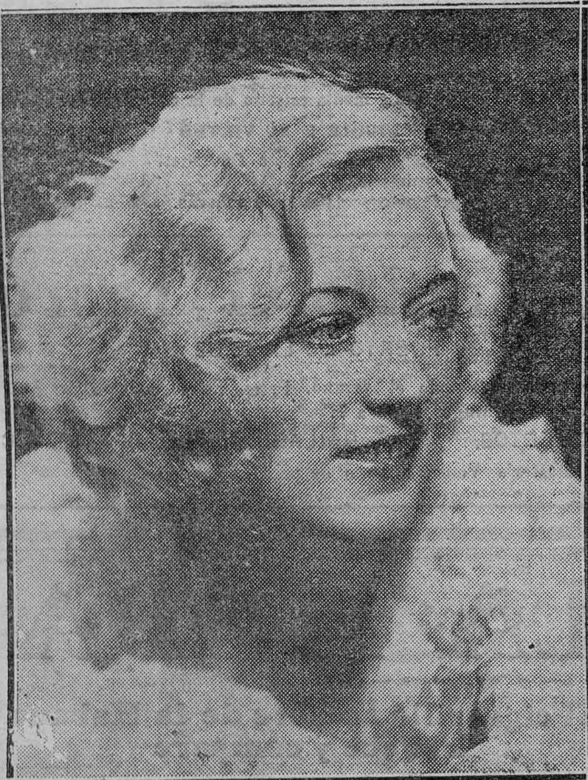
Figuras de la pantalla

—Pues muy sencillo—contestó—, el que arma escándalo continuamente es Adolfo y el que se pasa la vida durmiendo es Pablo.