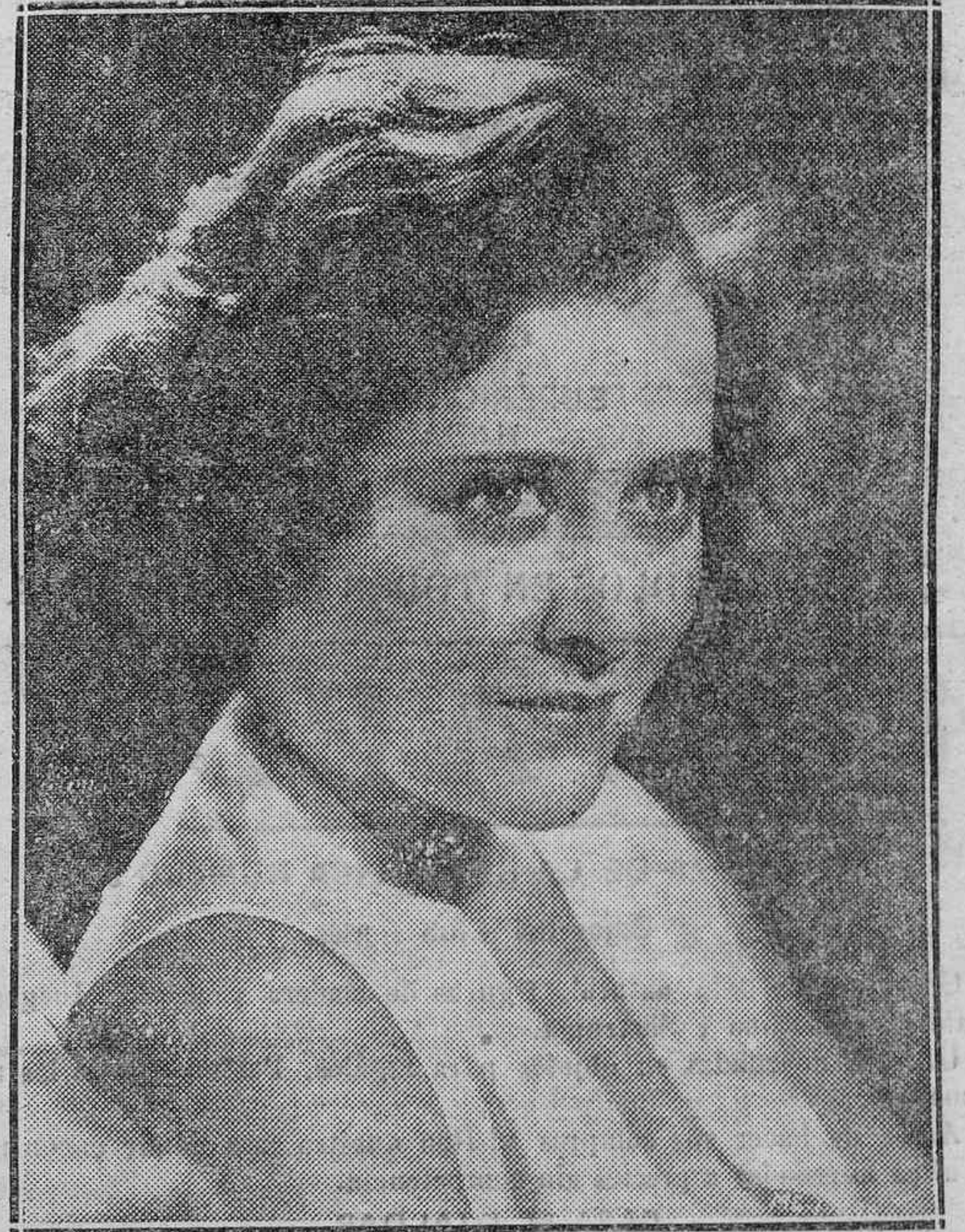
Figuras de la pantalla