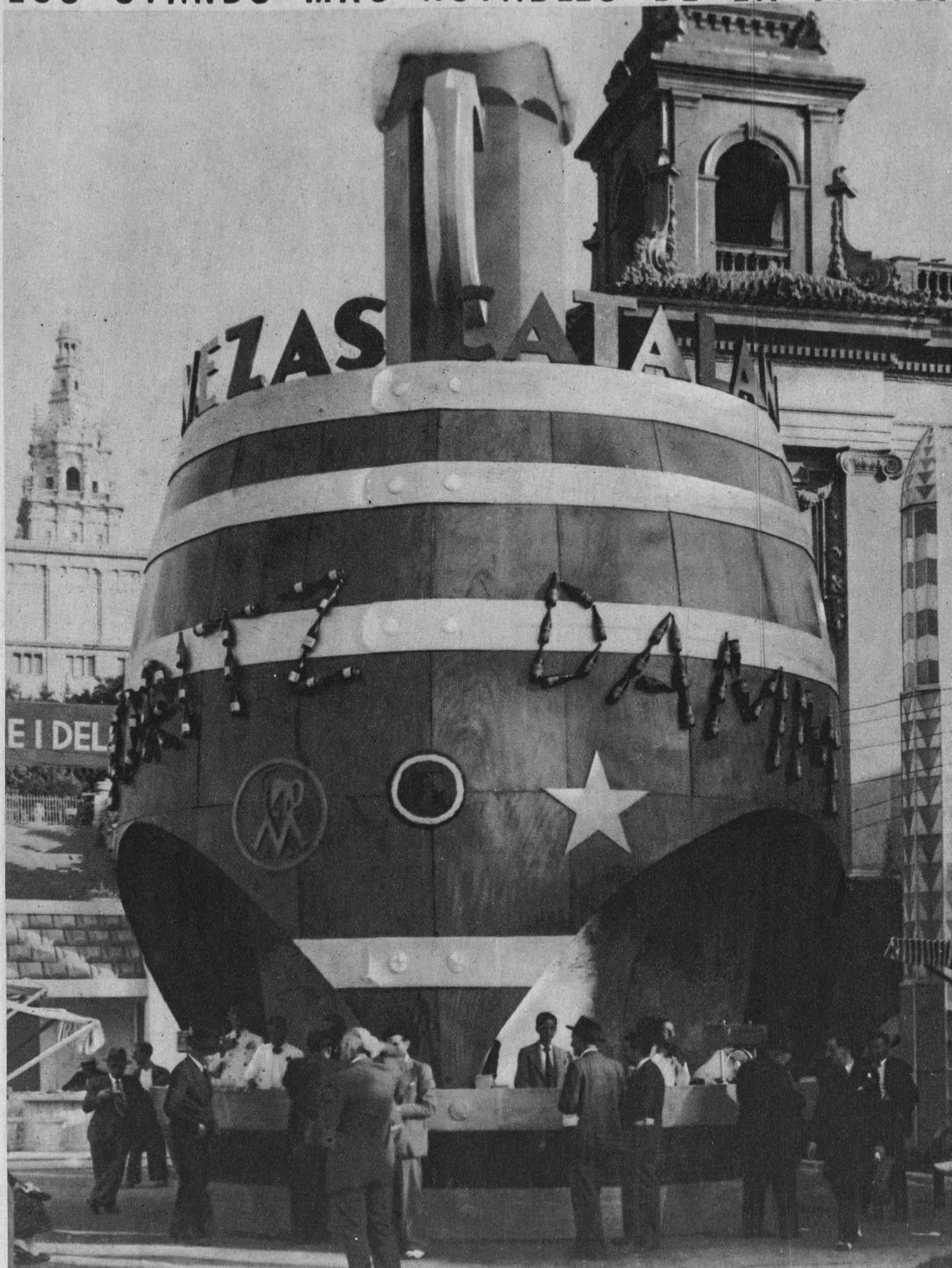
Artístico y popular stand que las insuperables marcas «Moritz» y «Damm», reunidas, presentan tradicionalmente en nuestras Ferias, y que cada año alcanza mayor éxito, situado en la plaza central que separa los dos grandes Palacios de la Feria.