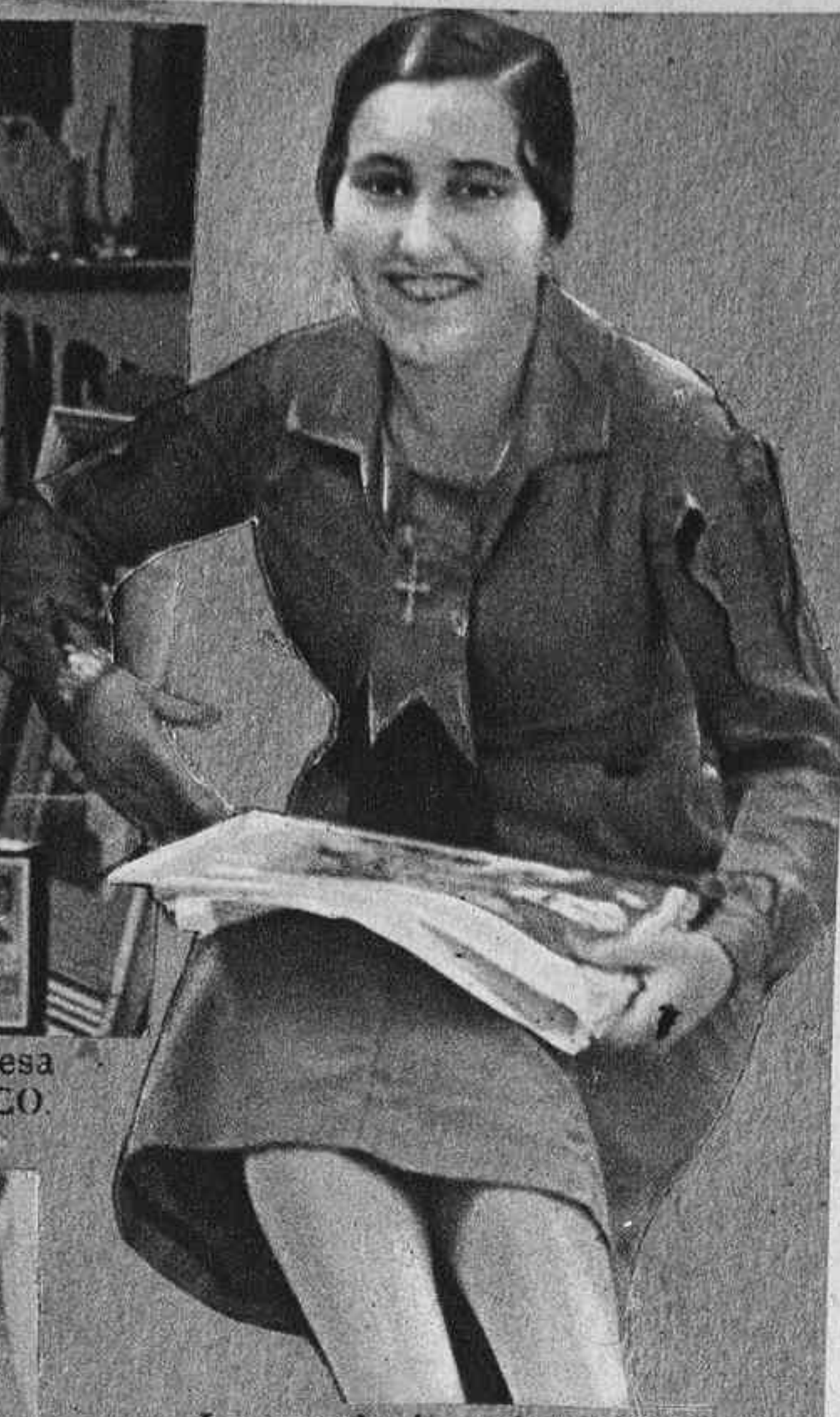
La revolucionaria señorita Teresina Junyent.