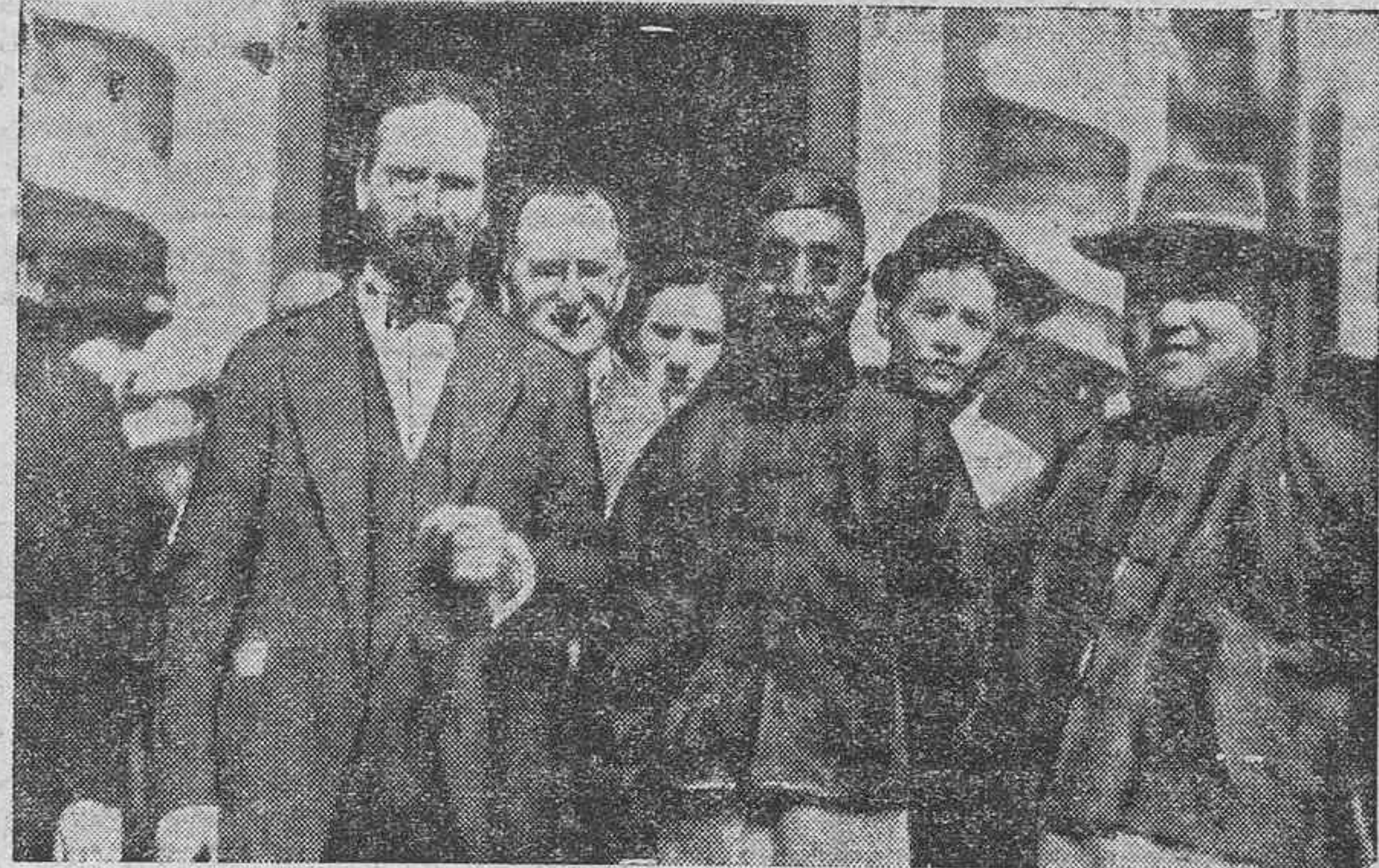
El embajador ruso al llegar a Pekín, donde fué recibido con muestras de simpatías por la población