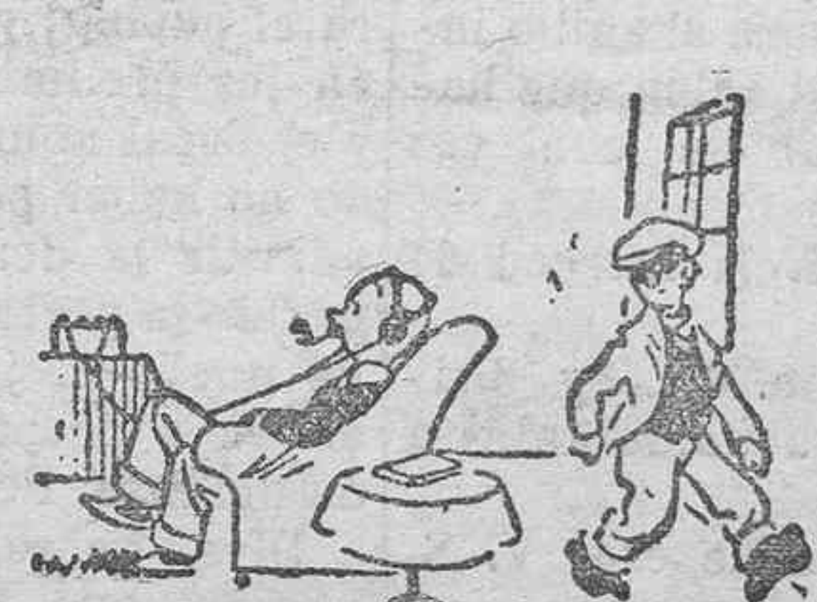
...ellos se introducen por la ventana visitan toda la casa minuciosamente...