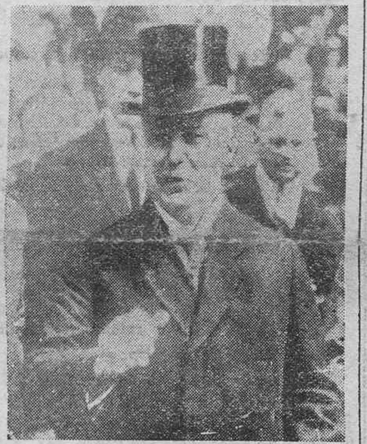
El general Ludendorff, que según nuestros telegramas de anoche ha renunciado la jefatura del partido nacional-socialista alemán

Descansen en paz y reciban sus familiares nuestro pésame.