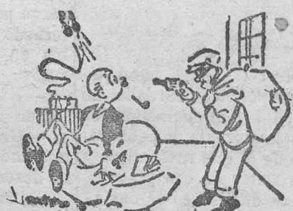
...y se van tranquilamente con su botín