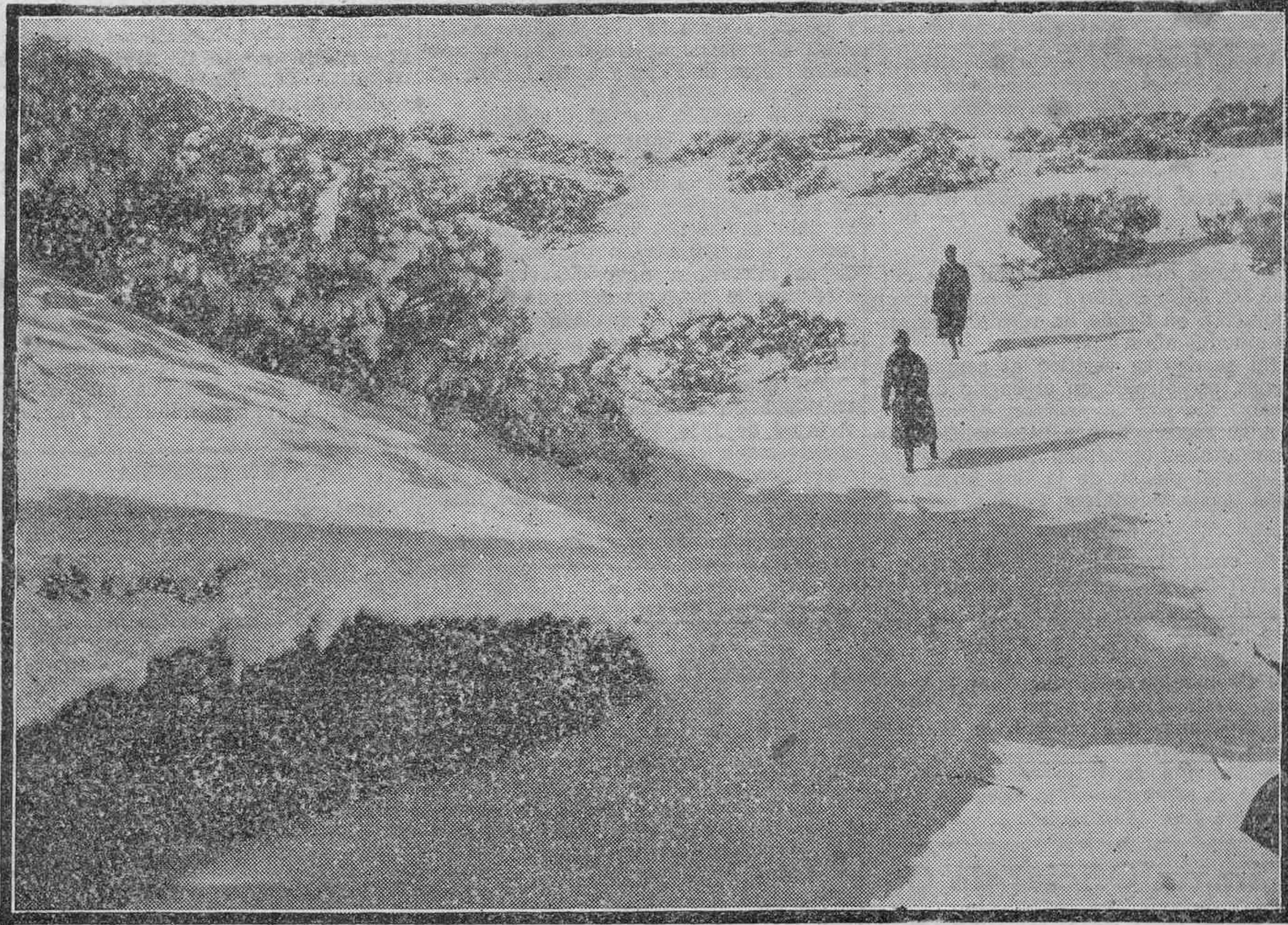
LAS GRANDES NEVADAS EN EL TEIDE.—Un aspecto de las Cañadas.