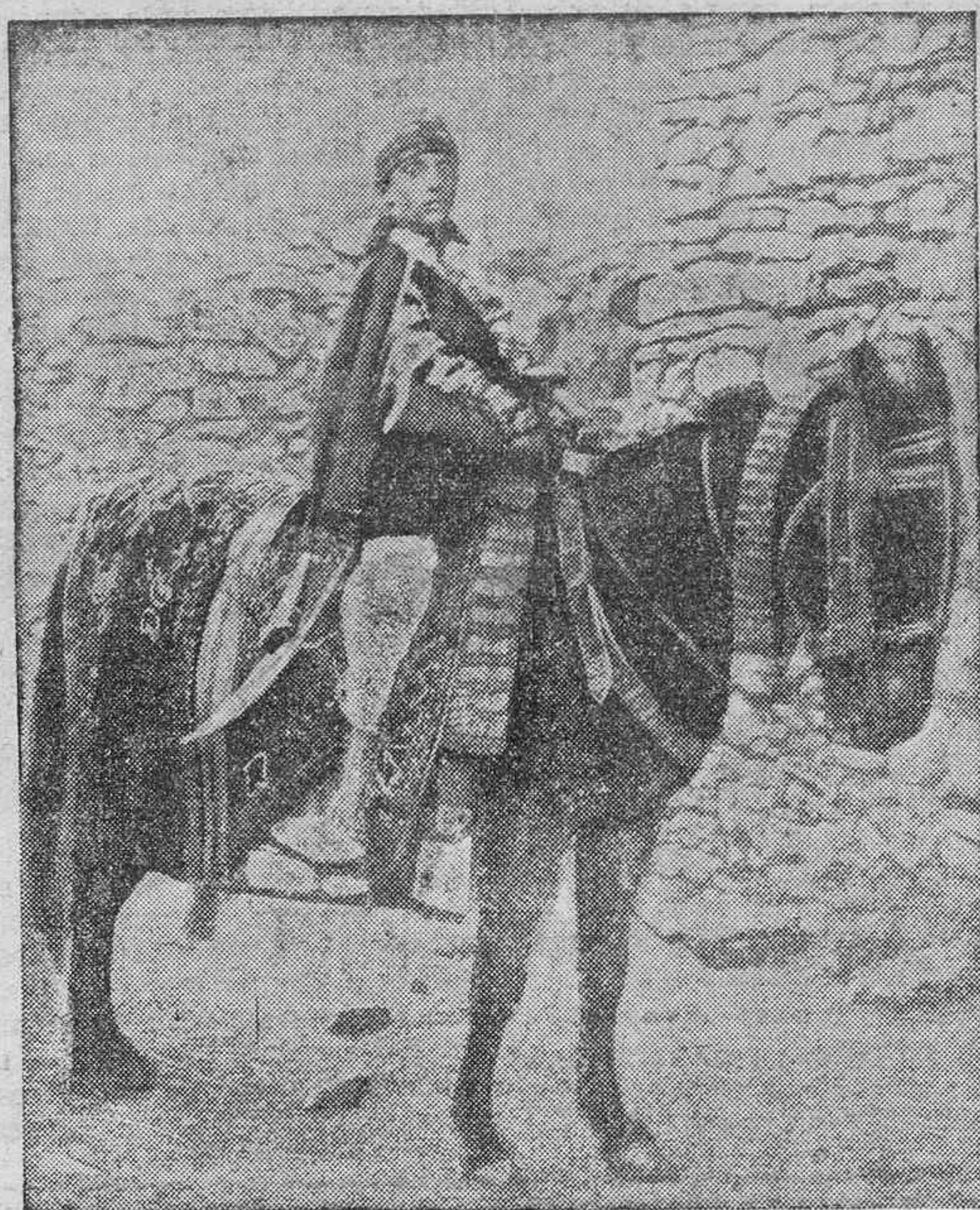
El ras Guga, que se rindió a las fuerzas italianas, y que, por sus derechos, debía ocupar el trono de Abisinia. La foto es de 1826, cuando la primera campaña italiana en Etiopía.