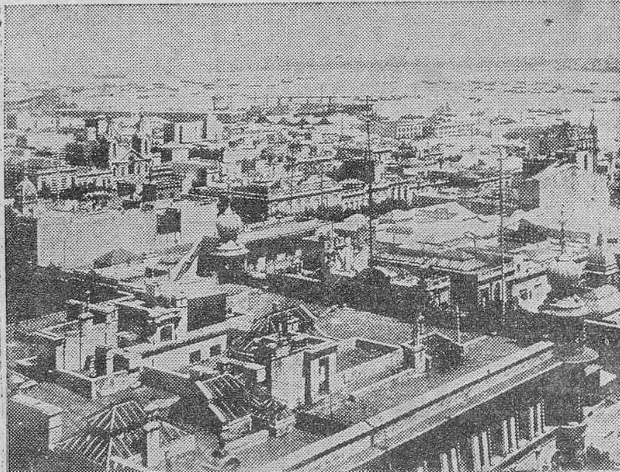
SHANGHAI AMENAZADO DE CAER EN PODER DE LOS JAPONESES.—Un aspecto de la población (a la izquierda), y un detalle de la concesión internacional (a la derecha).—Según las noticias de ayer, prosiguiendo su objetivo de aislar Shanghai de la retaguardia, las tropas japonesas han ocupado el aeropuerto de Shanghai, en Hungyao.