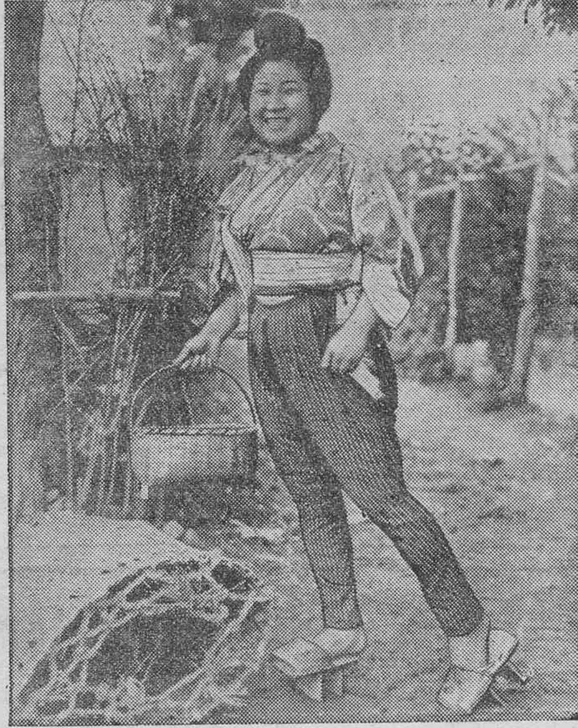
ESTAMPAS DE ORIENTE.—Joven japonesa, sorprendida por el objetivo fotográfico en la intimidad de su jardín.