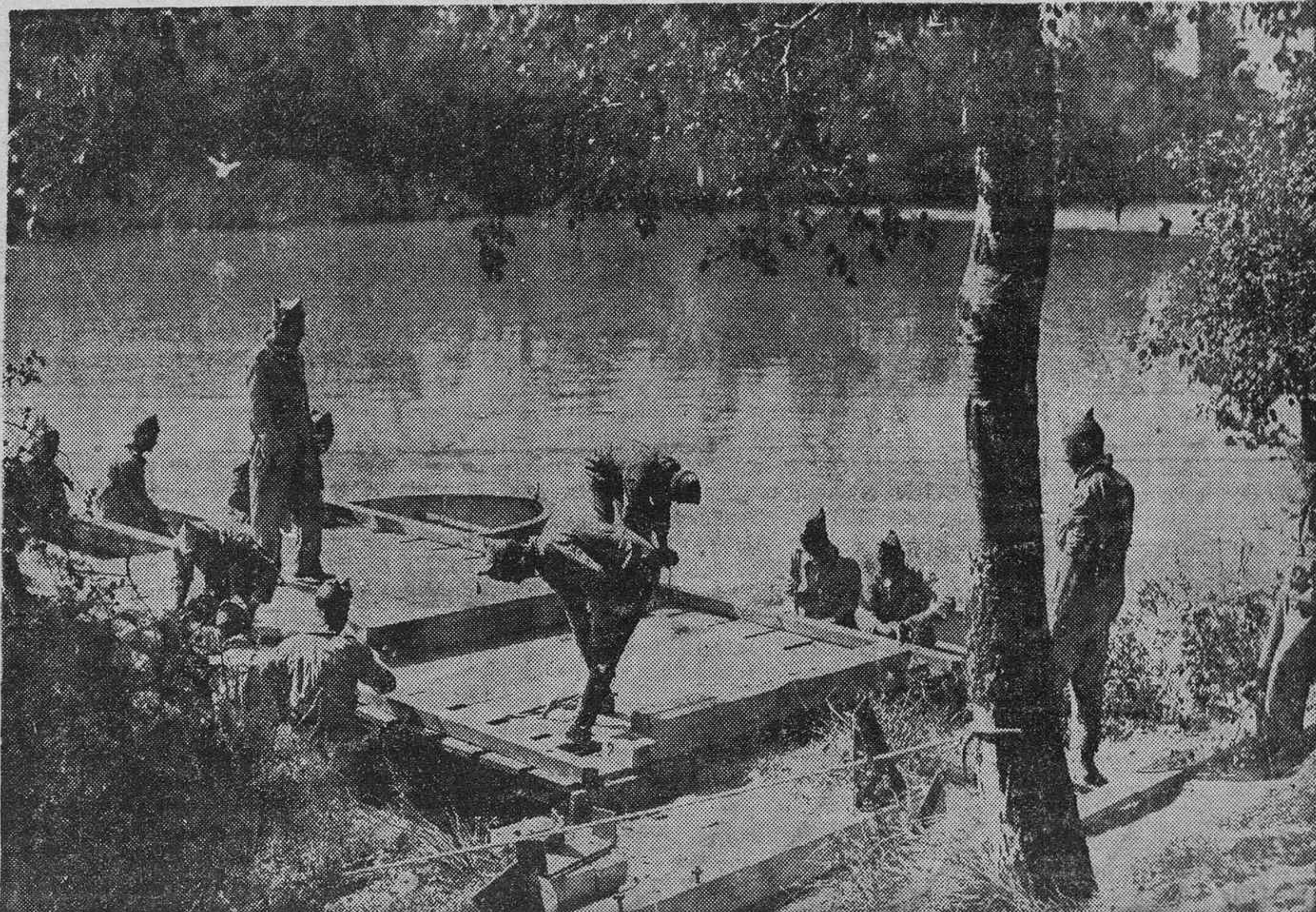
UNA VISTA DEL MANZANARES.—Pontoneros del Ejército construyendo un puente de balsas para vadear el río.