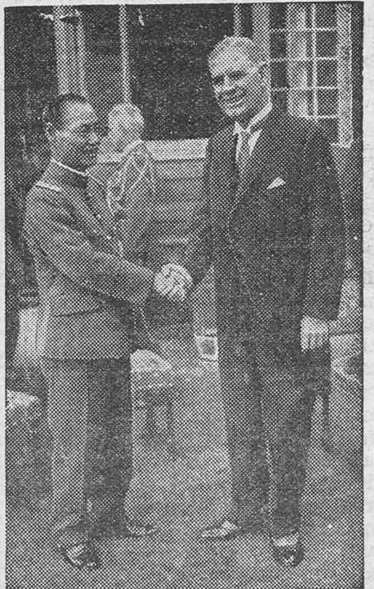
El ministro de la Guerra norteamericano (a la derecha), que según telegramas de ayer ha fallecido a consecuencia de rápida enfermedad. Le acompaña el ministro de la Guerra japonés.