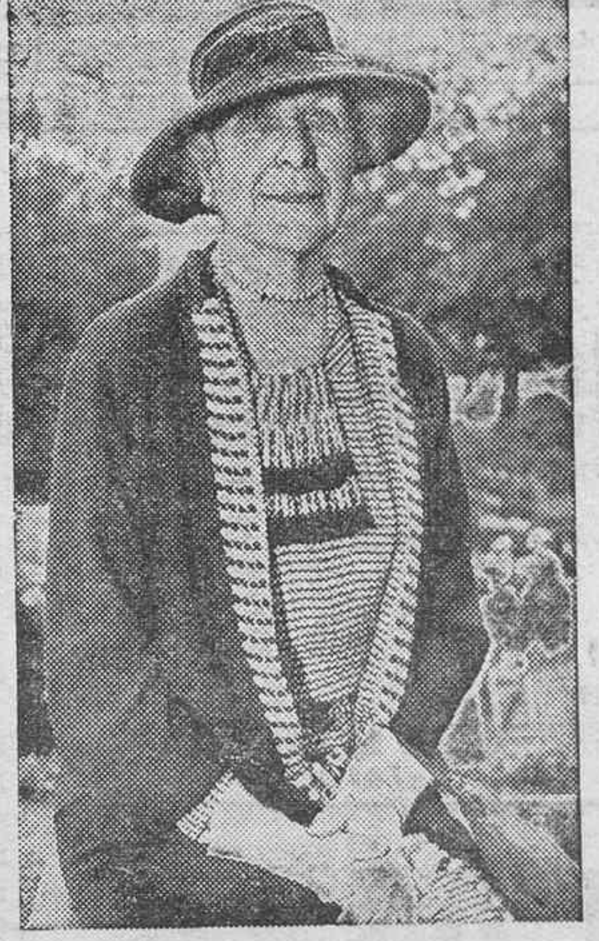
La embajadora de los Estados Unidos en Dinamarca, Mrs. Bryan Owen, que presenta su candidatura para la vicepresidencia de la República, apoyada por el partido democrático.