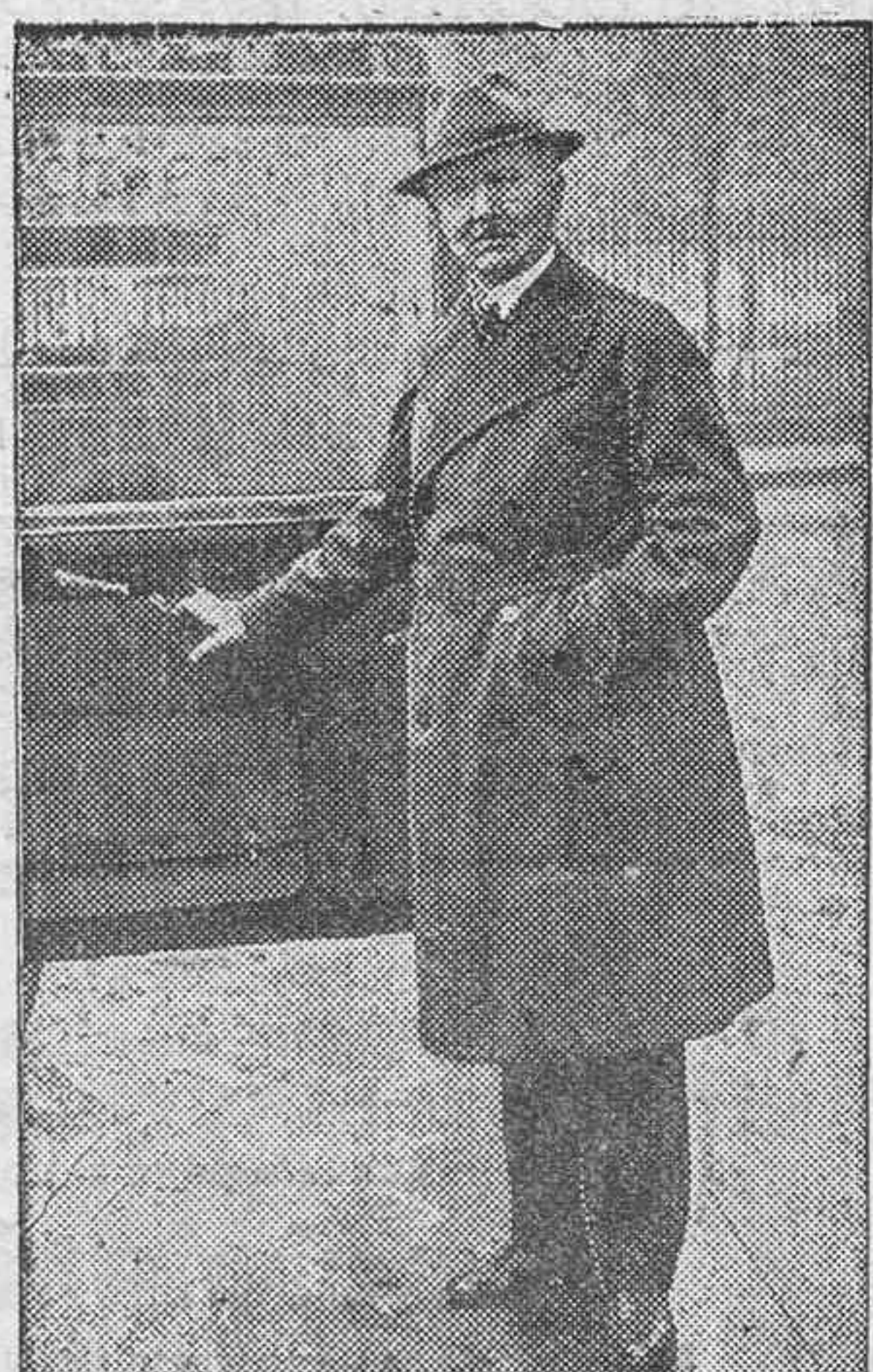
El doctor Schacht, presidente del Reichsbank, que ha sido agasajado en París con un banquete al que asistieron el jefe del Gobierno y varios ministros, cambiándose afectuosas frases.