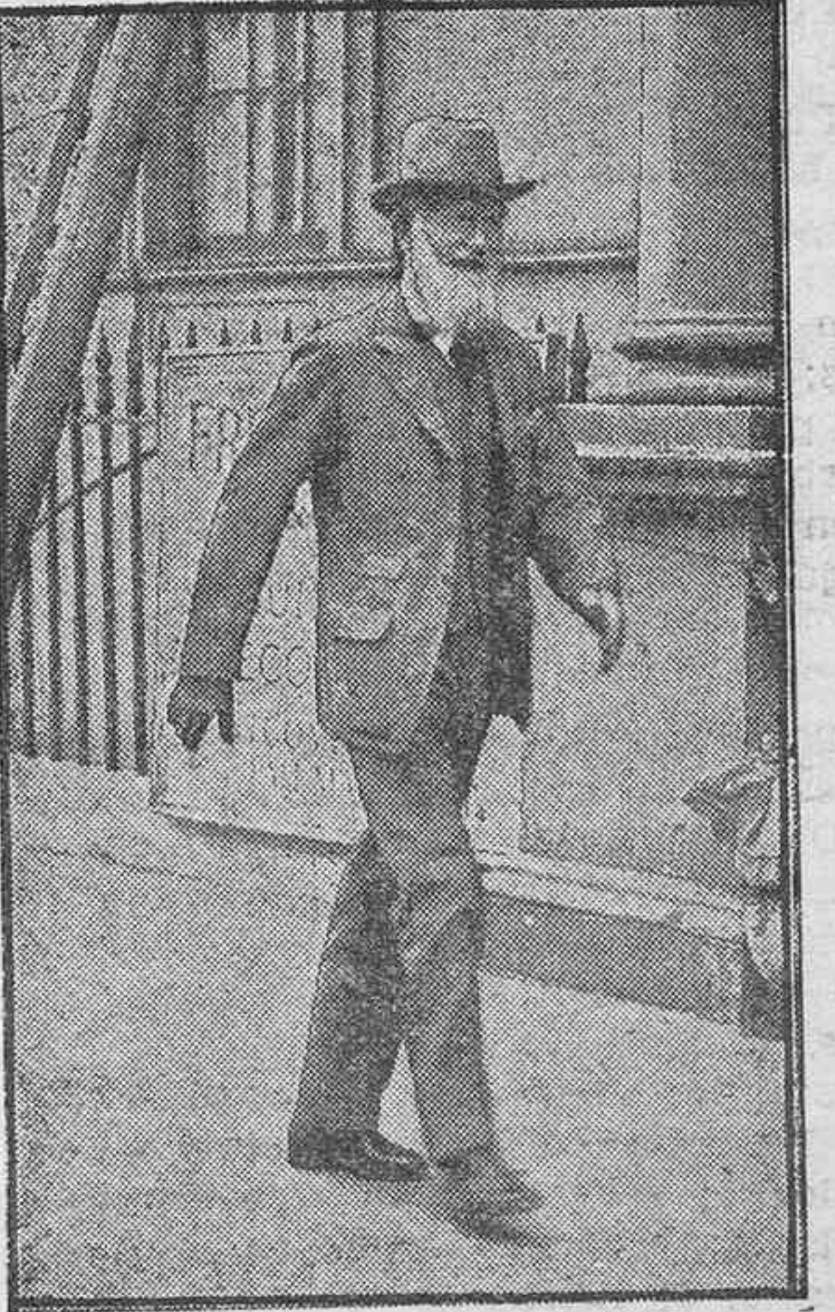
El célebre escritor inglés, Bernard Shaw, que acaba de celebrar el 80 aniversario de su nacimiento, recibiendo con tal motivo muchas felicitaciones de sus innumerables admiradores.