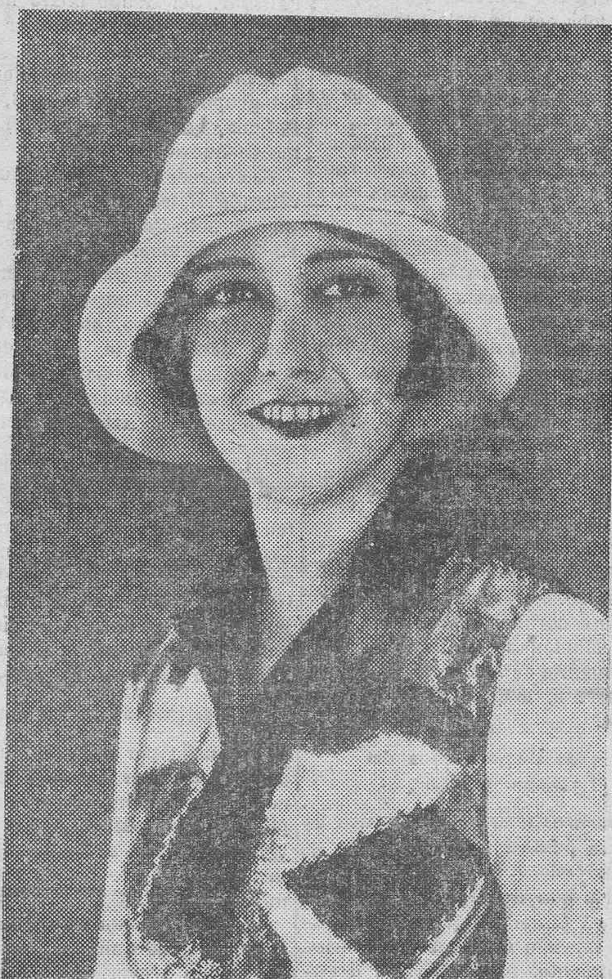
ARTISTAS CELEBRES.—Dorothy Sebastian